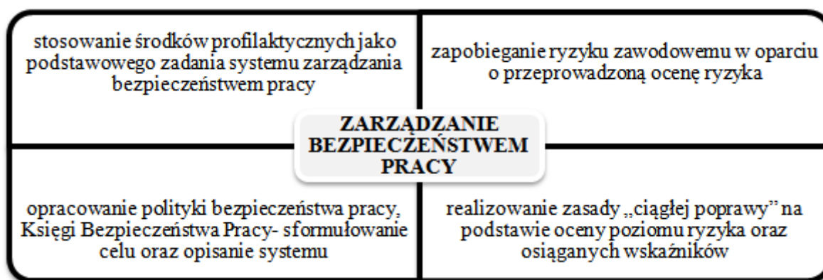
Rys. 1. Zarządzanie bezpieczeństwem pracy