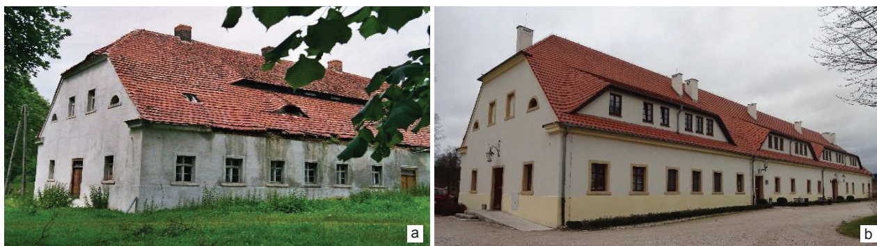
Il. 1. Wojanów, stajnia:

a) przed remontem (fot. J. Grochowski, 2004) oraz b) po jego przeprowadzeniu (fot. A. Marcinów, 2015)