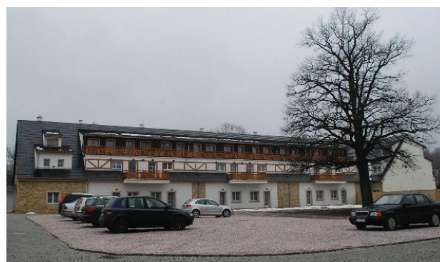
Il. 3. Stanisław Dolny, nowy budynek w miejscu dawnego gospodarczego

W zachowanej stajni prace nie zostały jeszcze wykonane. Budowla w dolnej kondygnacji będzie miała gabinety zabiegowe i basen, w górnych zaś pokoje hotelowe [18]. Koncepcja przewiduje zachowanie istniejącej bryły obiektu, planowane są w niej jednak pewne zmiany. W części poddasza, z którego zostanie wydzielona druga kondygnacja użytkowa, pojawią się dwa rzędy lukarn pasowych z balkonami, analogiczne do tych wykonanych w nowo powstałym budynku. Pierwotnie stajnia miała niskie lukarny tego typu. Dach z naczółkiem zostanie zastąpiony zwykłym dwuspadowym dachem. W budynku nie planuje się zachowania oryginalnych otworów okiennych i drzwiowych. Zarówno stajnia, jak i pozostałe obiekty zyskają dużo elementów drewnianych w celu nadania im rustykalnego wyglądu. W Wojanowie mur pru-