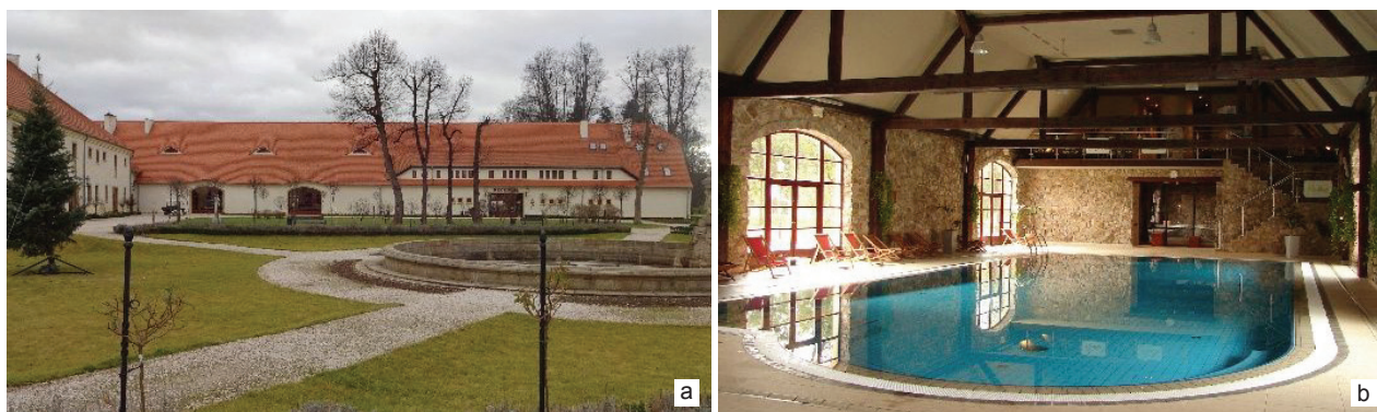
Il. 2. Wojanów: a) odbudowana stodoła, elewacja frontowa oraz b) wnętrze – część basenowa (fot. A. Marcinów, 2015)

Fig. 2. Wojanów: a) rebuilt barn, front elevation and b) interior – swimming pool part (photo by A. Marcinów, 2015)