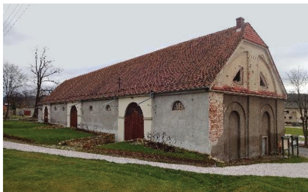
Il. 5. Bukowiec, wyremontowana stodoła (fot. A. Marcinów, 2015)