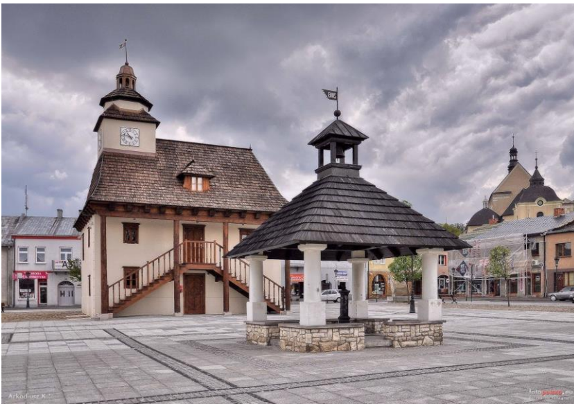
Fig. 4. The reconstructed town hall in Pilica.

Ryc. 3. Rynek w Sieradzu po rewitalizacji.