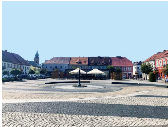
Fig. 3. The Market Square in Sieradz after revitalization.

Ryc. 2. Zarys dawnego sieradzkiego ratusza w posadzce rynku.