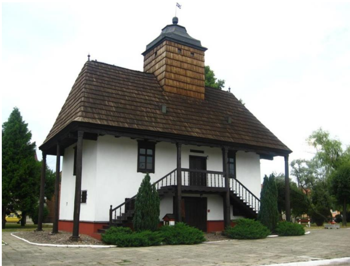
Fig. 1. The town hall in Sulmierzyce.

Ryc. 1. Ratusz w Sulmierzycach. Ostatni drewniany ratusz.