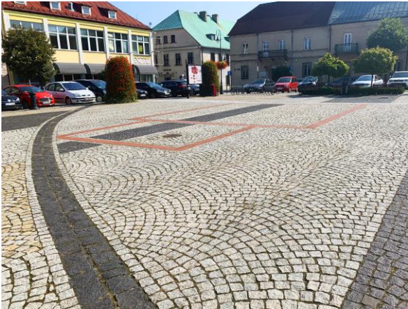
Fig. 2. Outline of the former town hall in Sieradz in the market square floor.

Ryc. 2. Zarys dawnego sieradzkiego ratusza w posadzce rynku.