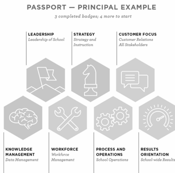
Rys. 1. Strona organizacji Matchbook – zdjęcie pokazujące przykładowe odznaki http://www.matchbooklearning.com/methodology/badges

tekstylnych naszywek, także ich cyfrowe odpowiedniki nadawane mogą być przez uprawnione instytucje osobom posiadającym szczególne umiejętności lub zasługi. Ich cyfrowa natura stwarza jednak dodatkowe możliwości, które mogą być wykorzystane w procesie edukacyjnym. Nic dziwnego zatem, że w kolejnych latach wiele różnych instytucji, szczególnie w Stanach Zjednoczonych i Wielkiej Brytanii, w tym także szkoły wyższe, zaczęły wykorzystywać nowy standard na swoich kursach, głównie e-learningowych, skierowanych do regularnych studentów i osób pragnących zdobyć dodatkowe wykształcenie. Niektórzy twórcy platform do prowadzenia zajęć online także udostępnili swoim użytkownikom nową funkcjonalność w postaci odznak potwierdzających ukończenie przez kursantów kolejnych etapów programów e-learningowych.