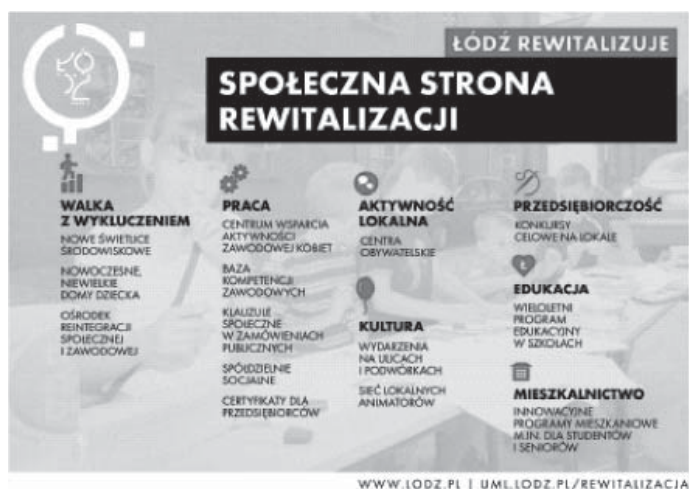
Il. 1. Idea społecznej strony rewitalizacji w Łodzi – Schemat