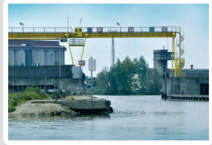
Fot. 2. Port śródlądowy w Płocku