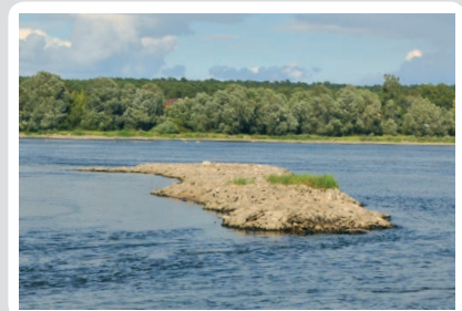
Fot. 1. Ostrogi na dolnej Wiśle

Budowle hydrotechniczne służące żegludze śródlądowej spełniają wiele innych funkcji. Regulują bieg rzeki (fot. 1), wpływają na rozwój turystyki, przyczyniają się do polepszenia stanu jakości wód (m.in. turbiny elektrowni wodnych poprawiają napowietrzanie wody). Obiekty wodne zapobiegają także procesowi pustoszenia obszarów oraz spełniają funkcję przeciwpowodziową.