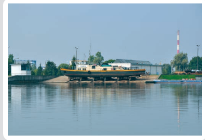
Fot. 3. Port rzeczny we Włocławku, fot. P. Jerzyto