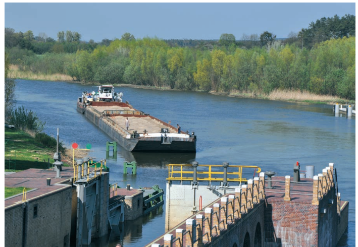
Photo 5. A barge-pusher assembly entering the lock in Biała Góra

The inland navigation fleet, built mostly in the 1970s, is obsolete, i.e. worn out technically and economically.