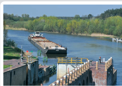
Fot. 5. Zestaw pchany wpływający do służy w Białej Górze

Tabor żeglugi śródlądowej, w większości wybudowany w latach 70. ubiegłego wieku, jest przestarzały, tzn. zużyty technicznie i moralnie.