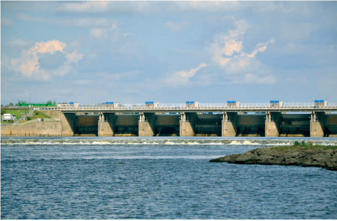
Photo 6. The Włocławek barrage, view from the lower water

The third section of the lower Vistula (dolna Wisła) waterway, from the Nogat to the mouth of the Vistula (Wisła), is also fully engineered. The width of the river engineering route applied there (250 m) ensures that the depths on sandbars do not drop to below 1.60 m. Only near Piekło, over a 5 km section, the depths decrease on sandbars to about 1.30 m. From the navigation perspective, the Przekop Wisły (Vistula Channel) is a problem in its own right. The river is linked with Gdańsk port via a lock at Przegalina, but so far it has no direct connection with the North Port. It is connected with the Vistula Lagoon via the lock in Gdańska Głowa and the Szkarpada River, or via the Nogat River.