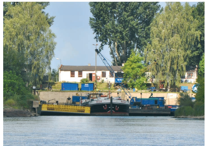
Photo 4. Inland port in Chełmno (referred to as Fig. 2a)