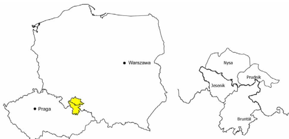
Ryc. 1. Lokalizacja analizowanego obszaru.

Fig. 1. The location of the territory under consideration.