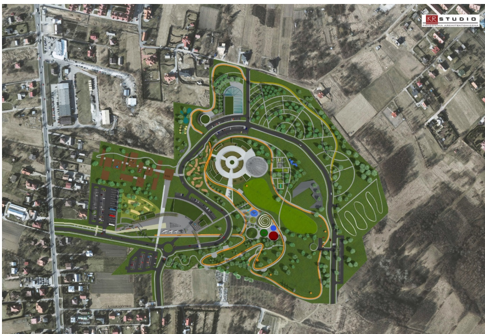
Ryc. 1. Konceptcja całego parku [za:] Konceptcja strefy rekreacji wraz z częścią o charakterze ogrodu zoologicznego

osiem stref odpowiadających różnym formom biernego i aktywnego wypoczynku w otoczeniu zieleni miejskiej.