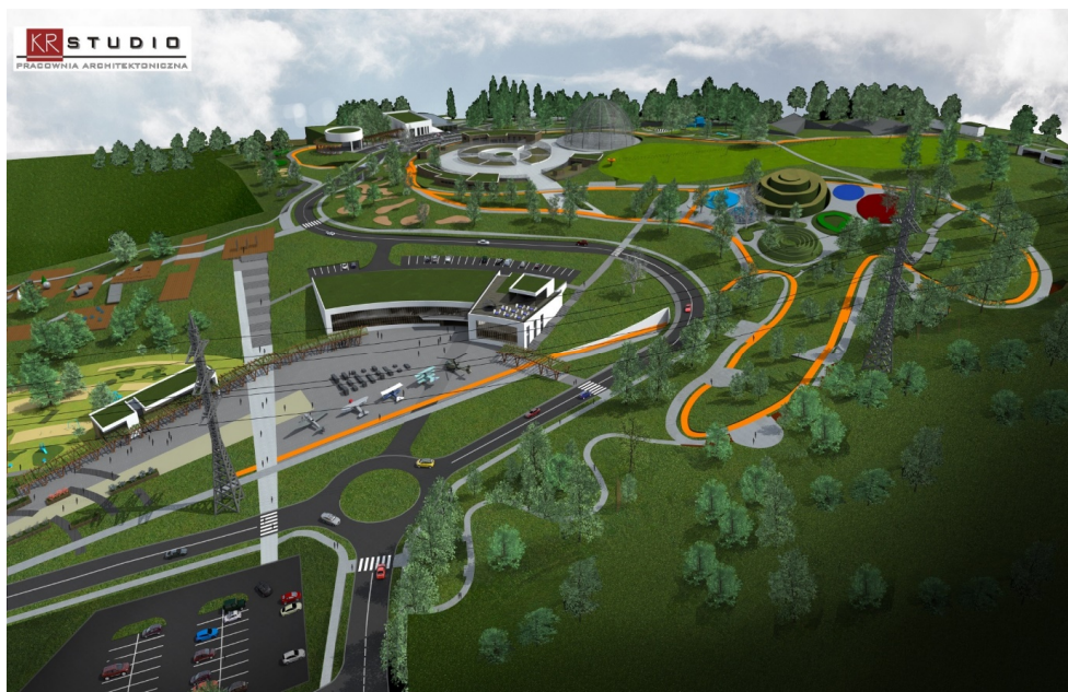
Ryc. 4. Widok z lotu ptaka na park [za:] Konceptja strefy rekreacji wraz z częścią o charakterze ogrodu zoologicznego