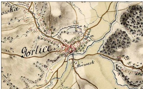
Ryc. 7. Układ urbanistyczny Gorlic zaznaczony na Pierwszym Zdjęciu Wojskowym z lat 1779–1783; mapa [w:] Archiwum Narodowe w Wiedniu, www.mapire.eu (dostęp: 26 VIII 2020).

Fig. 7. Urban layout of Gorlice marked on the First Military Survey from the years 1779–1783; map [in:] Austrian State Archives, www.mapire.eu , (accessed: 26 VIII 2020).