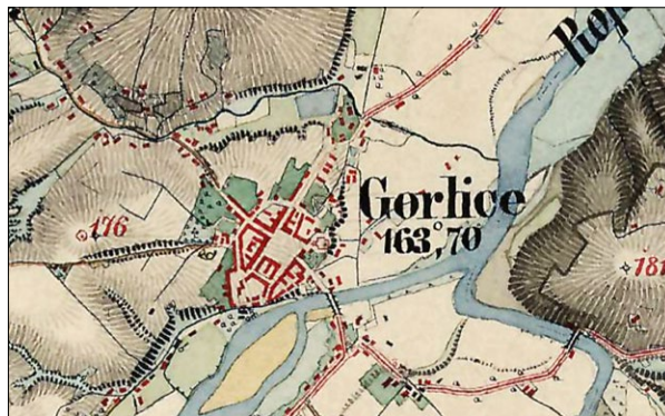
Ryc. 8. Układ urbanistyczny Gorlic zaznaczony na Drugim Zdjęciu Wojskowym z lat 1861–1864; www.mapire.eu (dostęp: 26 VIII 2020).

Fig. 7. Urban layout of Gorlice marked on the First Military Survey from the years 1779–1783; map [in:] Austrian State Archives, www.mapire.eu , (accessed: 26 VIII 2020).