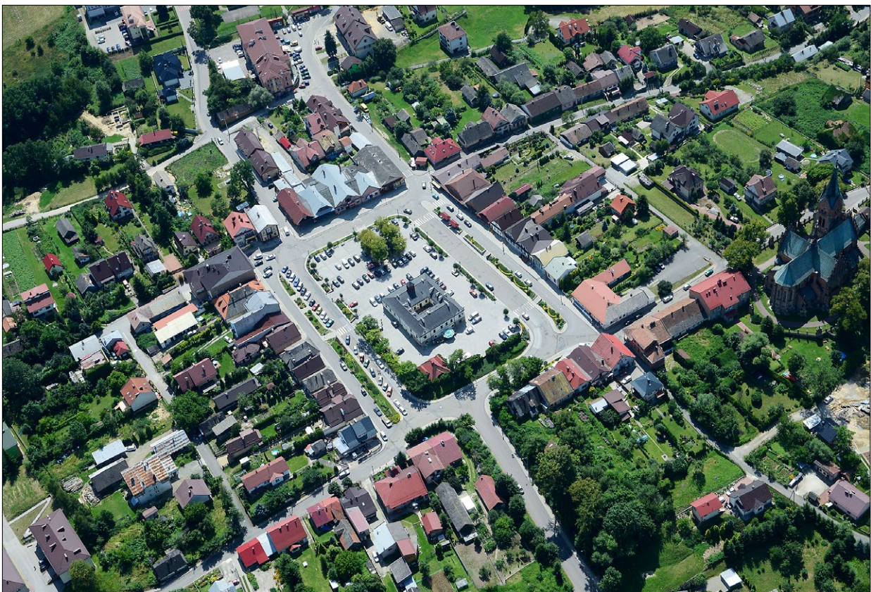
Ryc. 3. Ciężkowice, widok na średniowieczny układ urbanistyczny z lotu ptaka. Fig. 3. Ciężkowice, a bird's-eye view of the medieval urban layout.