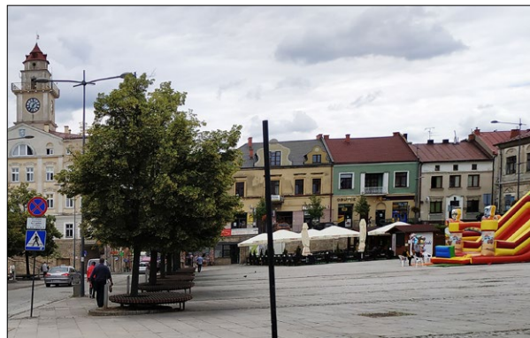
Ryc. 10 a, b, c, d. Rynek w Gorlicach obecnie; fot. w zbiorach KHAiKZ WA PK.