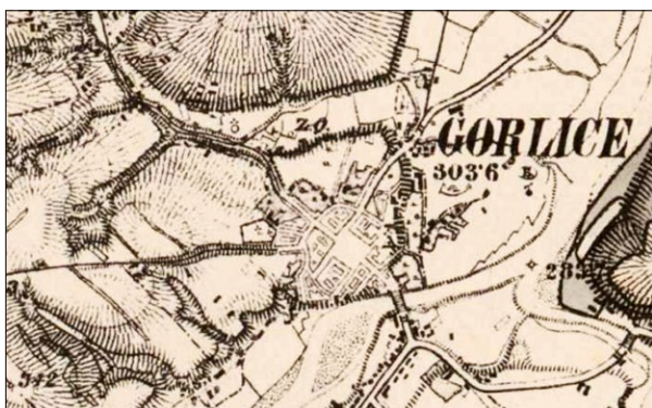
Ryc. 9. Układ urbanistyczny Gorlic zaznaczony na Trzecim Zdjęciu Wojskowym z lat 1869–1887; www.mapire.eu (dostęp: 26 VIII 2020).

Fig. 8. Urban layout of Gorlice marked on the Second Military Survey from the years 1861–1864; www.mapire.eu (accessed: 26 VIII 2020).