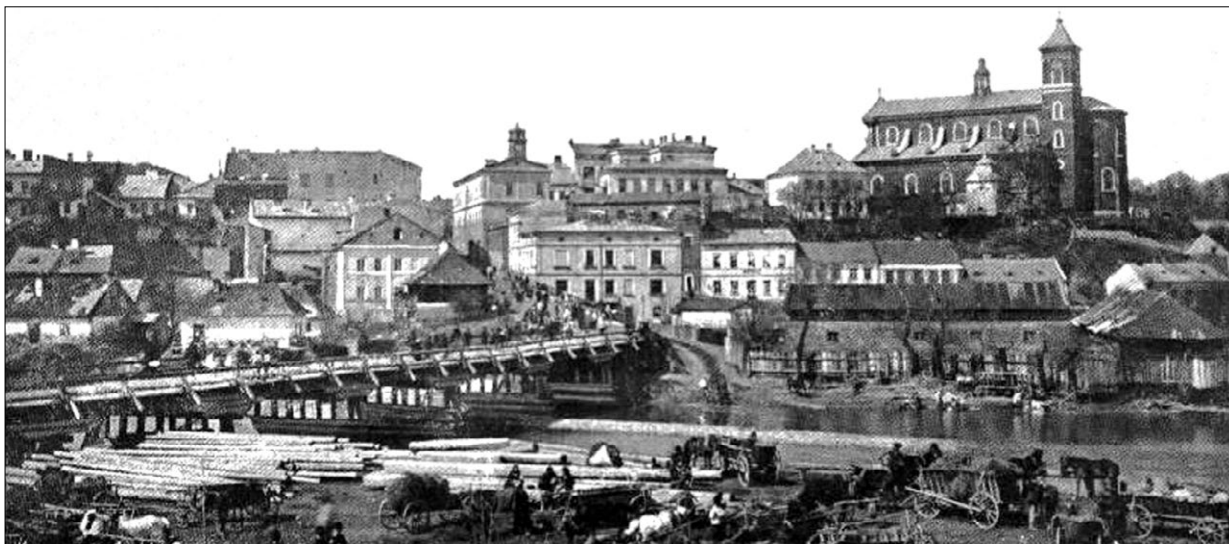
Ryc. 4. Widok na rynek w Gorlicach w pierwszej połowie XX wieku; kopia fot. w zbiorach Katedry Historii Architektury i Konserwacji Zabytków Wydziału Architektury Politechniki Krakowskiej.