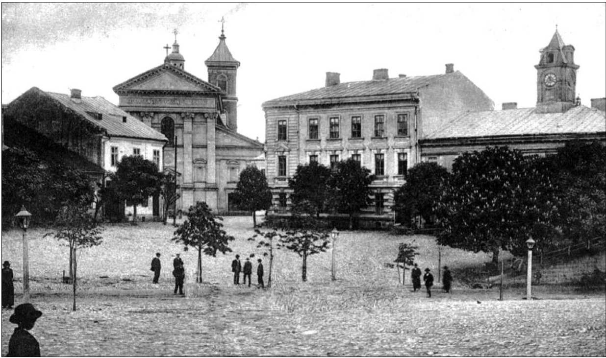
Ryc. 5. Widok na rynek w Gorlicach w pierwszej połowie XX wieku; kopia fot. w zbiorach KHAiKZ WA PK.