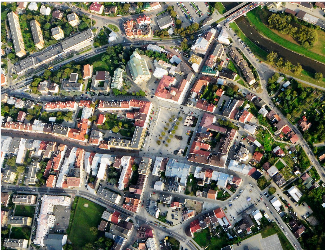
Ryc. 1. Gorlice, widok na średniowieczny układ urbanistyczny z lotu ptaka; fot. W. Gorgolewski 2017.