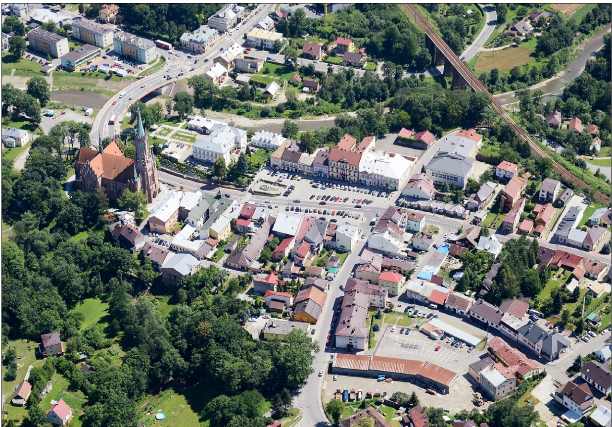
Ryc. 2. Grybów, widok na średniowieczny układ urbanistyczny z lotu ptaka. Fig. 2. Grybów, a bird's-eye view of the medieval urban layout.