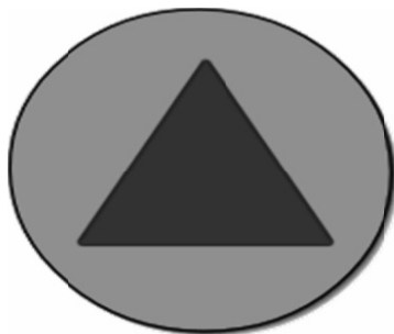
Rysunek 2. Znak rozpoznawczy obrony cywilnej – niebieski trójkąt na pomarańczowym tle w kształcie koła

Problemem związanym z ochroną prawną działań obrony cywilnej jest jej identyfikacja. Każda strona konfliktu powinna dołożyć starań, by jej organizacje obrony cywilnej, ich personel, budynki i materiały mogły być zidentyfikowane, gdy są całkowicie przeznaczone do zadań obrony cywilnej. Do tego celu służą międzynarodowe znaki rozpoznawcze obrony cywilnej i karty tożsamości dla jej personelu. Bez swoich znaków rozpoznawczych obrona cywilna nie mogłaby istnieć. Kolokwialnie określając problem można powiedzieć, że znaki rozpoznawcze obrony cywilnej powinny stanowić jedyną broń jej członków przed przeciwnikiem (rys. 2).