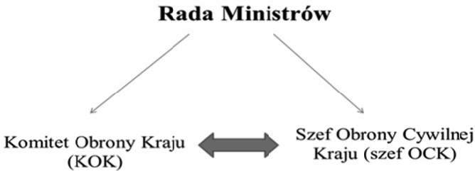
Rysunek 1. Struktura OC na szczeblu administracji państwowej w PRL.