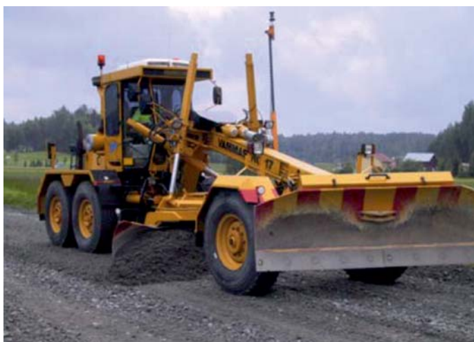
Fot. 2. Anteny transmisyjne na równiarce

podłoża o niskiej sztywności są zagęszczane z wysoką amplitudą, a podłoża o wysokiej sztywności z niską amplitudą. Amplituda oddziaływania jest automatycznie redukowana lub podwyższana w zależności od zmieniającej się charakterystyki podłoża. System sterowania i kontroli parametrów pracy zagęszczarek pozwala na: