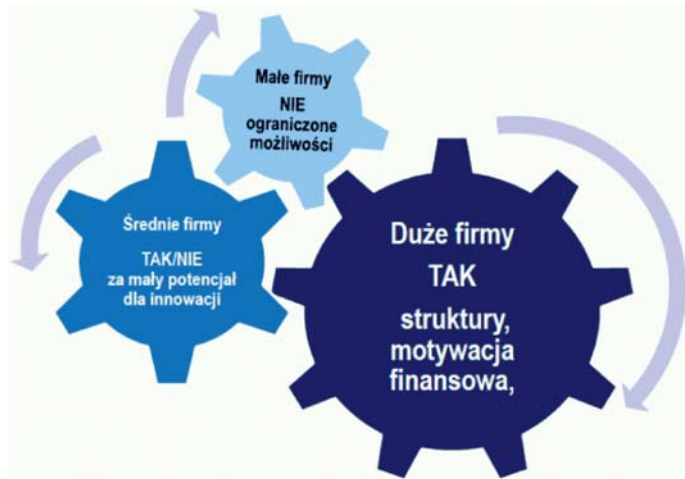
Rys. 3. Schemat podatności na innowacje IT firm realizacji budownictwa dróg lądowych [2]

odpowiedni stan finansowy i zdolności kredytowe przejawiają głównie duże przedsiębiorstwa i konsorcja wykonawcze. Istniejąca współpraca i systemy podwykonawców przy realizacji dużych programów rozbudowy dróg lądowych tworzą warunki do dalszego rozwoju technologii opartych na innowacjach IT (rys. 3). Sprzyjają temu obecnie rozpowszechnione formy leasingu oraz wynajmu sprzętu i maszyn budowlanych.