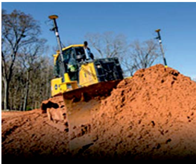
Fot. 1. Spycharka z wyposażeniem anten urządzeń transmisyjnych