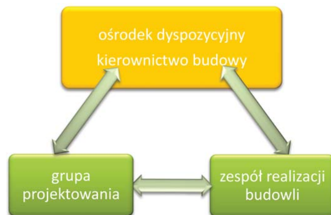
Rys. 2. Schemat integracji systemu realizacji budowli drogowych

Znaczące atrybuty systemowe wprowadzania unowocześnień oraz innowacji IT , powodują też konieczność ponoszenia znacznych nakładów inwestycyjnych w nowoczesnie wyposażone maszyny i sprzęt. W warunkach krajowych,