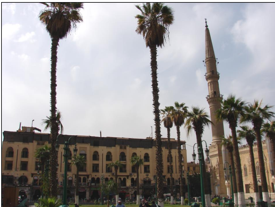
Fot. 4. Najstarszy budynek na bazarze Chan al-Chalili (opisany przez Brémonda), a tuż obok meczet piątkowy Al-Husajna. Photo 4. The oldest building in Khan el Khalili (described by Brémond) with a Friday Mosque Al-Husayn in vicinity.

Photo 3. Grand Bazaar in Tehran: A. Men at work; B. Noon prayer in a nearby mosque ... thinkin about work.