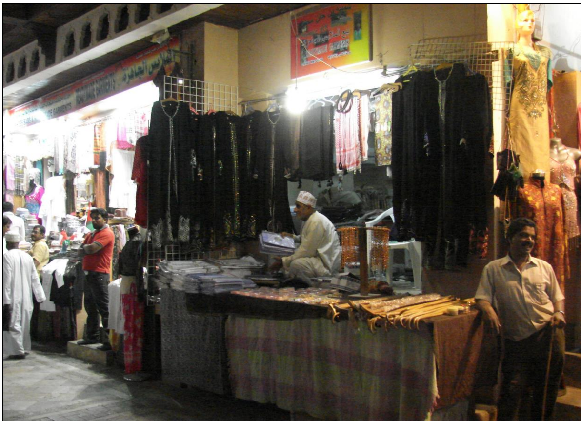
Photo 1. Fashion at the bazaar: A. The most fashionable Aladdin lamps, from Istanbul to Muscat and Rabat; Elegant women are shopping at the Muscat souk.

Fot. 2. Siedzisko z rozłożonej okiennicy.