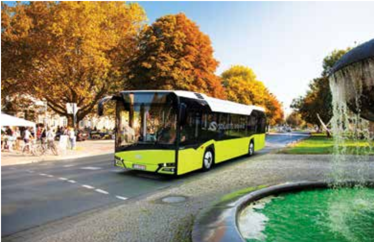
Elektromobilność to to istotny kierunek urzeczywistniania idei zrównoważonego rozwoju. Na Fot. Solaris Urbino 12 electric

nych wśród pieszych zmalała jedynie o 39% w porównaniu ze spadkiem o 49% w przypadku ofiar śmiertelnych wśród kierowców. Dlatego konieczne jest podjęcie dodatkowych działań w celu zwiększenia bezpieczeństwa ruchu drogowego w miastach oraz zapewnienia ochrony szczególnie narażonym uczestnikom ruchu drogowego przed ryzykiem śmierci i poważnych obrażeń.