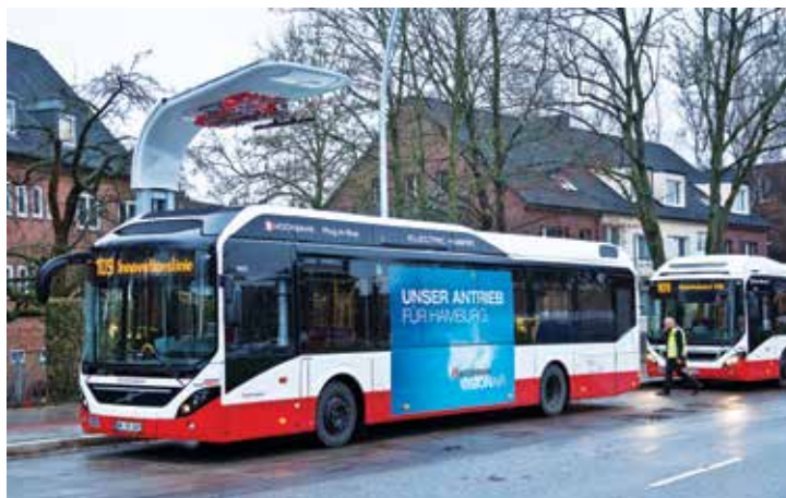
Zastosowanie technologii hybrydowej staje się coraz powszechniejszym kierunkiem ograniczania zużycia energii w komunikacji miejskiej. Na fot. Volvo 7900 Electric Hybrid w Hamburgu