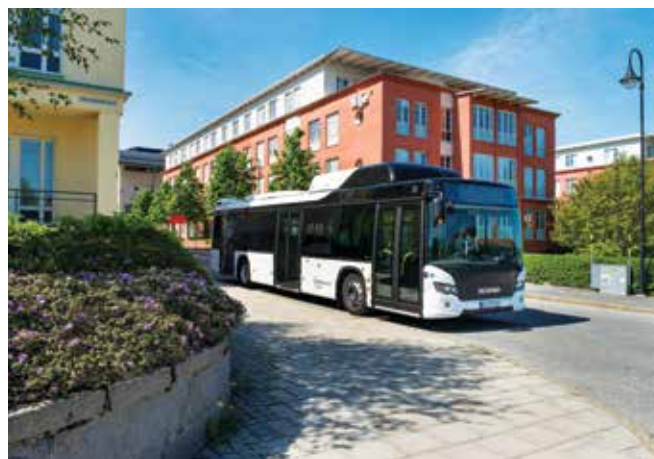
Zastosowanie paliw alternatywnych sprzyja ograniczeniu zużycia paliw ropopochodnych i emisji toksycznych substancji. Na fot. Scania Citywide LF 4x2 zasilana sprężonym gazem ziemnym w Södertälje (Szwecja)