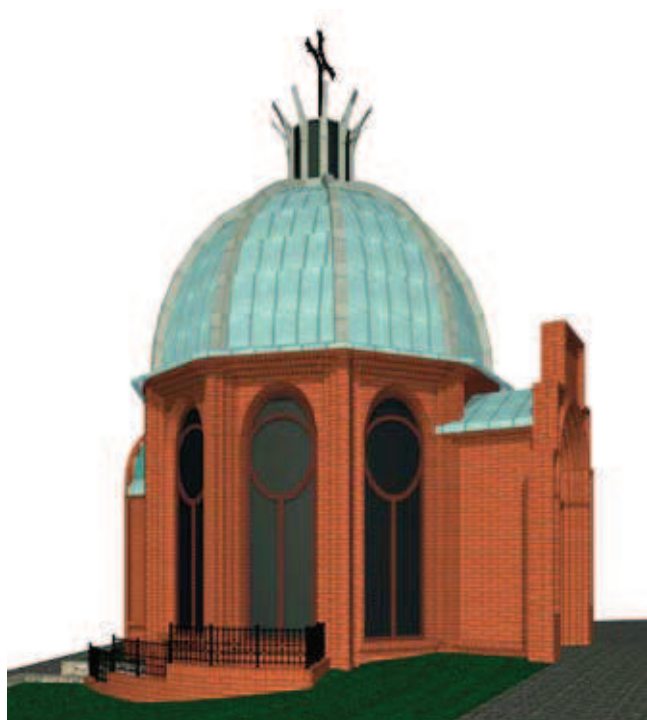
Rys. 3. Widok zaprojektowanej kaplicy od strony zachodniej (rys. autor)