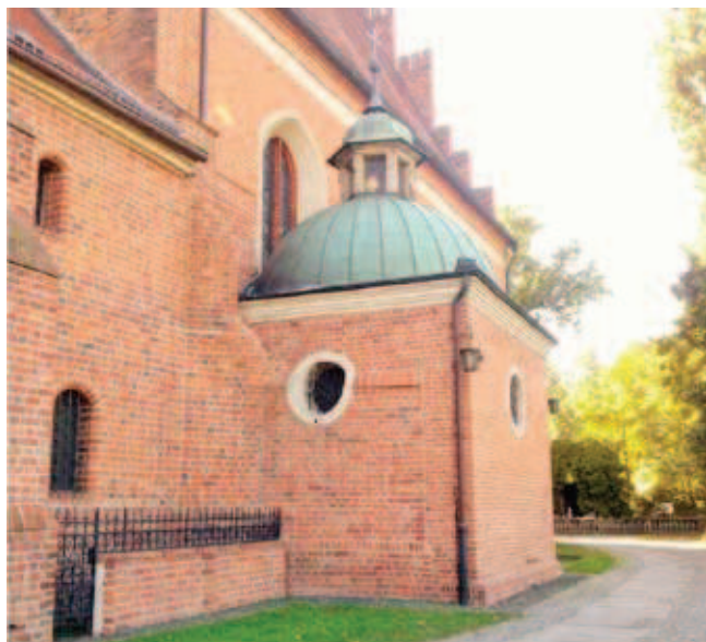
Rys. 1. Kaplica św. Krzyża

niej części korpusu nawowego) 7 zbudowana jest na planie kwadratu, nakryta kopułą na pendentywach, zwieńczoną sześcioboczną latarnią o dzwonowatym hełmie ze sterczyną i krzyżem (rys. 1).