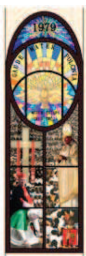
Rys. 5. Jedno z okien zaprojektowanej kaplicy – widok od strony wewnętrznej (rys. autor)

w Uchaniach. Rozpowszechnienie centralno-kopułowych kaplic grobowych na terenie Rzeczypospolitej postępowało stopniowo i wiązało się z wykształceniem ich nowych typów. Przekształcano, parafrazowano i redukowano wzorcowe założenia kaplicy Zygmuntońskiej, tworząc obiekty o nowym wzorze dekoracji i wyposażeniu, dostosowane do miejscowej tradycji, warsztatu twórcy czy oddziaływania rozmaitych kierunków sztuki.