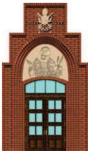
Rys. 4. Portal zaprojektowanej kaplicy (rys. autor)