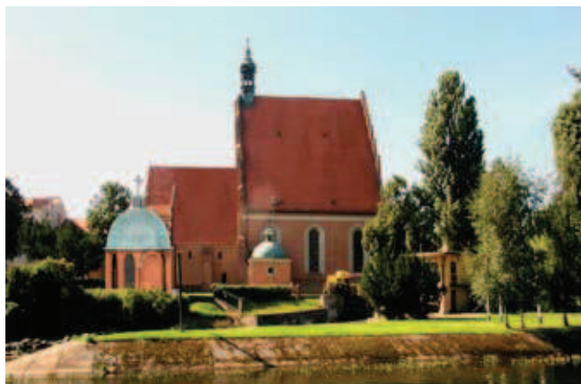
Rys. 6. Widok od strony północnej na katedrę wraz z zaprojektowaną kaplicą (rys. autor)

detalu architektonicznego projektowanej kaplicy nie kopiuje historycznych rozwiązań, a jedynie do nich nawiązuje w taki sposób, aby obiekt harmonizował z otaczającą go zabudową i jednocześnie nosił wyraźne cechy czasu powstania.