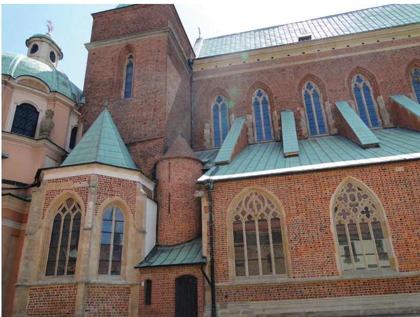
Fot. 7. Fragment elewacji południowej katedry po scaleniu kolorystycznym

W tym czasie poddano także konserwacji wnętrza kaplicy św. Elżbiety i kaplicy Zmarłych (obecnie Zmartwychwstania).