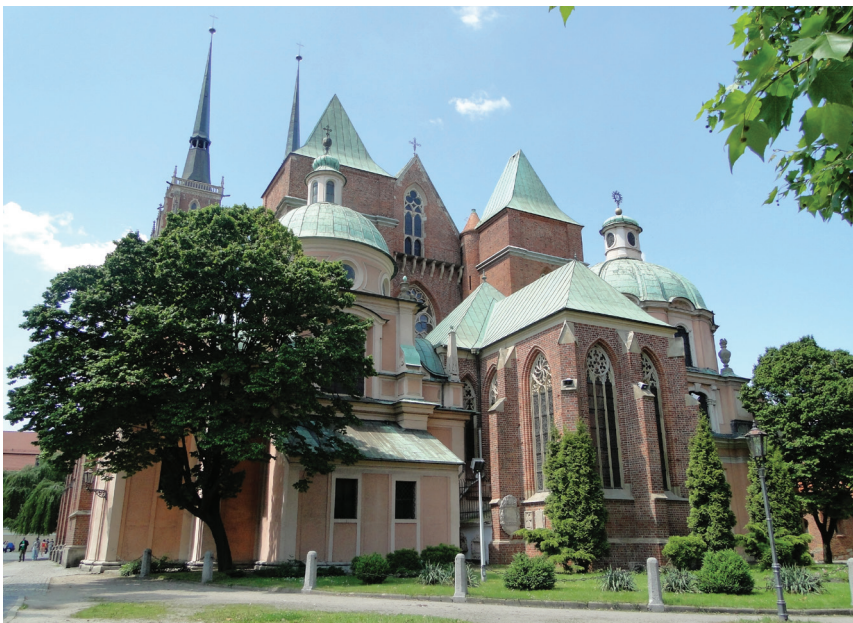
Fot. 6. Widok na katedrę od strony północno-wschodniej i kaplicę barokowe: św. Elżbiety oraz Elektorską (Bożego Ciała), flankujące gotycką kaplicę Mariacką