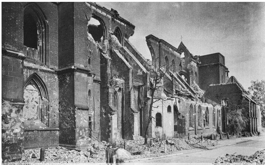
Fot. 2. Zniszczenia wojenne elewacji południowej 1945 r.

wieku. Fakt ten stworzył możliwość działań w zakresie restytucji katedry w nurcie dwudziestowiecznych teorii i poglądów konserwatorskich (fot. 1.).