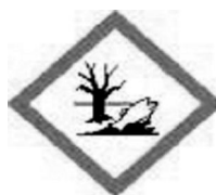
Niebezpieczne dla środowiska GHS09

Rys. 1. Piktogramy określone w rozporządzeniu WE nr 1272/2008 (CLP) mają czarny symbol na białym tle z czerwonym obramowaniem, na tle szerokim, aby być wyraźnie widoczne