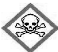
Ostra toksycznie ; GHS06