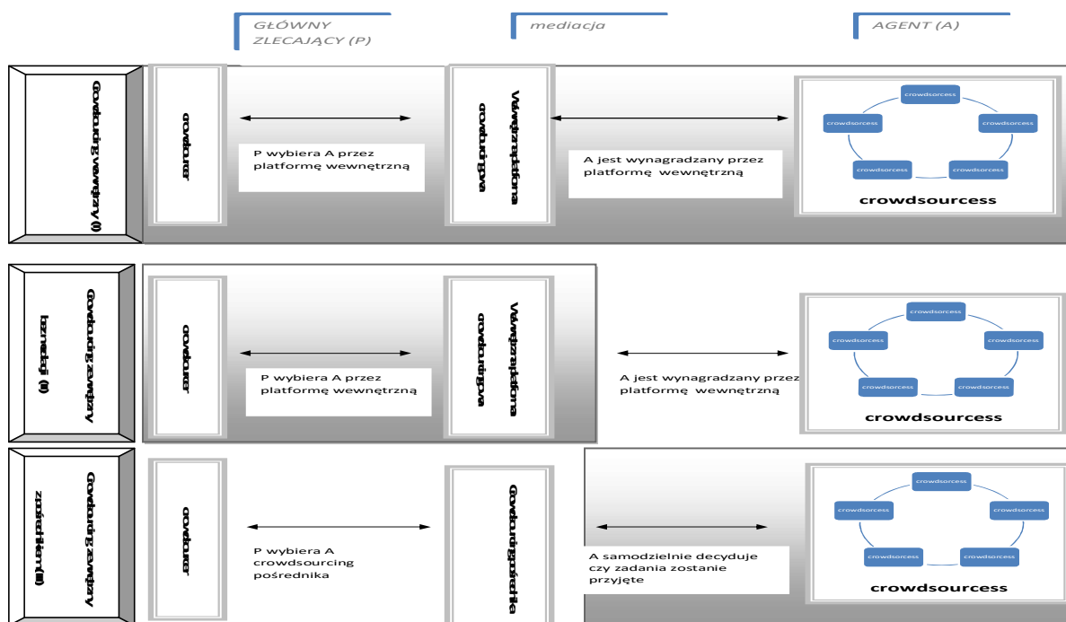
Rysunek 1. Role i i mediacje w modelach crowdsorcingu. J.M. Leimaister, Sh. Zogaj, Neue Arbeitsorganisation durch Crowdsourcing , Arbeit und Soziales, Arbeitspapier 287, Hans Böckler Stiftung, Juli 2013, s. 21.

W świetle dotychczasowych rozważań nie trudno wykazać, że crowdsourcing z perspektywy przedsiębiorstwa, delegując rozwiązanie problemu czy wykonanie określonych zadań poza przedsiębiorstwo jest nie tylko „aktem pracy”, lecz również innowacyjnym procesem świadczenia usług, bazującym na wiedzy tłumu. Chociaż budowę wspomnianego procesu może różnicować przyjęty przez przedsiębiorstwo model Crowdsourcingu, w procesie tym wyodrębnić można kilka następujących po sobie faz (rysunek 2), które przyporządkować można takim etapom procesu crowdsourcingowego, jak: zdefiniowanie problemu przez przedsiębiorstwo, transfer problemu do rozwiązania przez wybrany do pracy „tłum”, zgłaszanie propozycji rozwiązań przez „tłum”, weryfikacja i odrzucenie rozwiązań w ramach społeczności, wybór najlepszego rozwiązania oraz wprowadzenie rozwiązania.