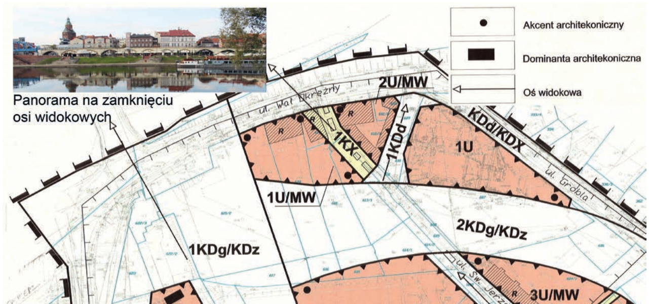
Il. 3 Fragment rysunku miejscowego planu zagospodarowania przestrzennego. Gorzów WLKP