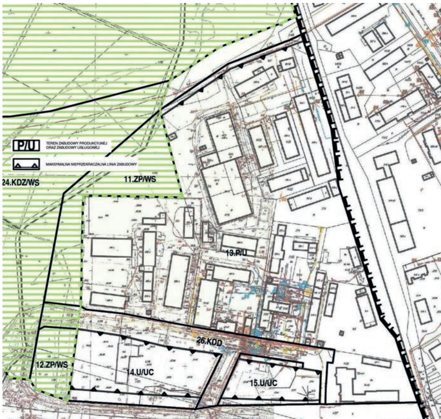
Il. 1. Fragment rysunku miejscowego planu oraz widok istniejącej przestrzeni na części terenu elementarnego 13 P/U i 14 i 15 U/UC