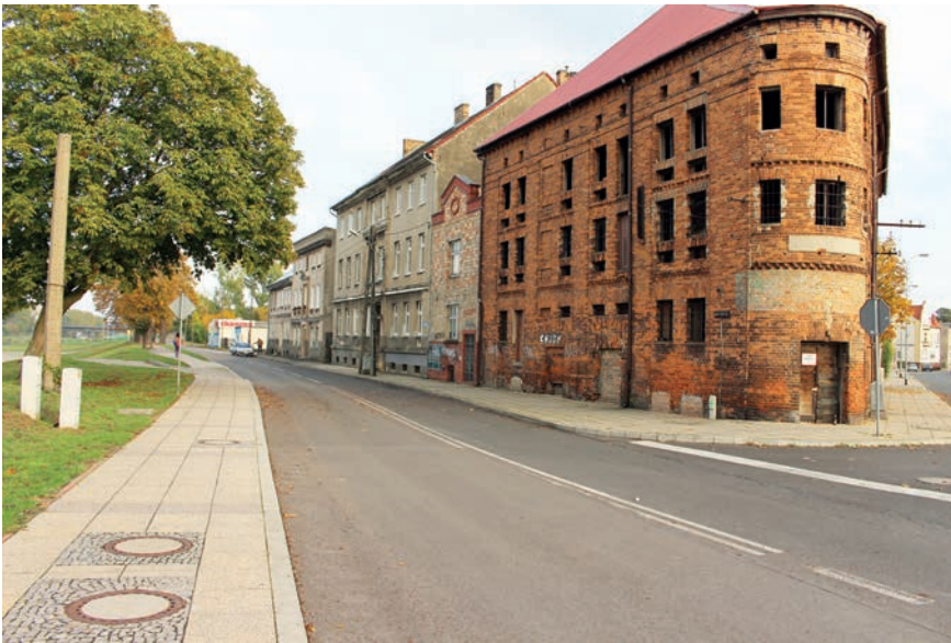
IL. 4 Fragment rysunku miejscowego planu oraz widok istniejącej przestrzeni na części terenu elementarnego MW/U 1, U 1, MW/U 6. Gorzów WLKP

Ill. 4 Part of the local plan design and view of existing space on a part of elementary area MW/U 1, U 1, MW/U 6, ZZ 1. Gorzów WLKP.