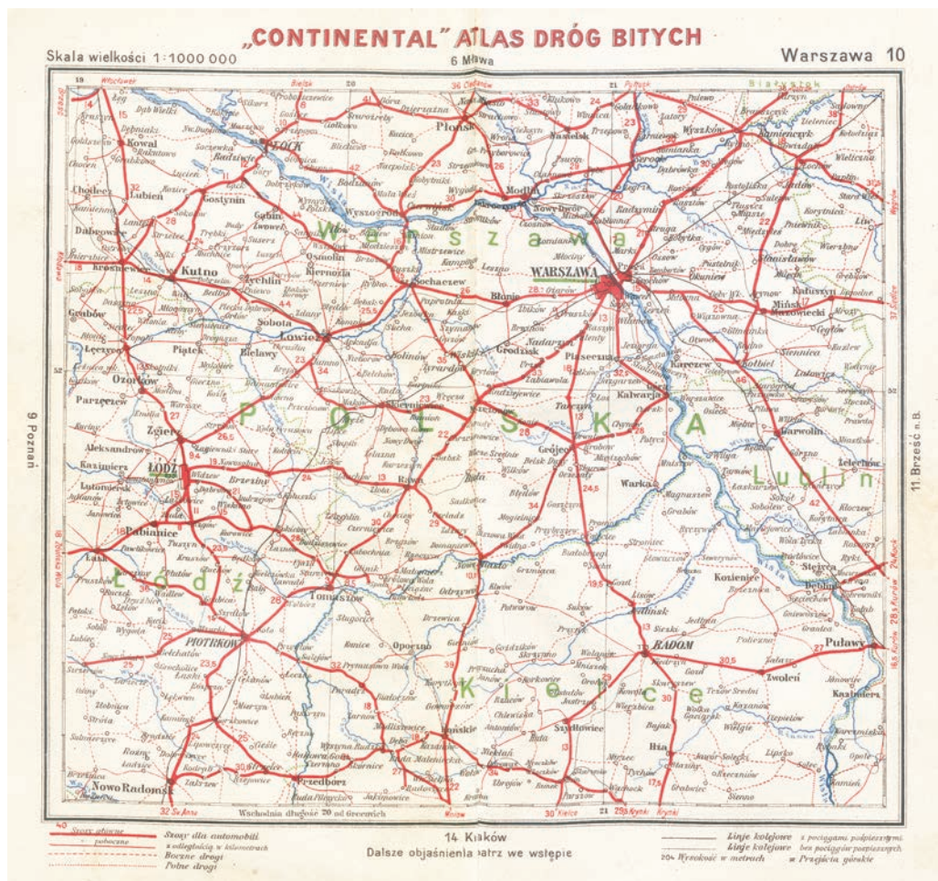
Ryc. 2. Jeden z arkuszy atlasu. Warszawa 10 (zmniejszony)

Kategoria ta to nic innego jak drogi w budowie („znaki i mosty już postawione”) oraz drogi projektowane. Wszystkie znajdują się na wschodzie kraju, gdzie infrastruktura drogowa była najbardziej zaniedbana.