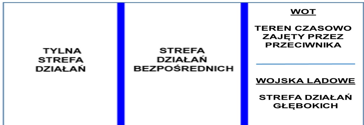
Rysunek 1: Obszary działań WOT i WL

mają strefę działań głębokich. Taka sytuacja nie powinna mieć miejsca, ponieważ to wojska lądowe będą wiodącym rodzajem sił zbrojnych w razie jakichkolwiek działań bojowych, a pododdziały lekkiej piechoty WOT będą albo im podporządkowane albo będą działały na korzyść wojsk lądowych. Wydaje się więc, że zastosowanie zaledwie jednego pojęcia dotyczącego tak skomplikowanego zagadnienia nie jest wystarczające, aby w zrozumiały sposób opisać stan posiadania przez przeciwnika obszaru działań zbrojnych.