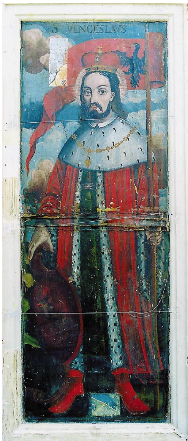
Fot. 1. Awers prawego skrzydła tryptyku z Łącka. Św. Wacław

go prawe skrzydło XV-wiecznego tryptyku, z XVII-wiecznym przedstawieniem św. Wacława. Skrzydło dwustronnie malowane, podzielone na cztery kwatery, pierwotnie pochodzące z II ćw. XV wieku, wykonane w technice tempery tłustej, zostało przemalowane od strony awersu w I poł. XVII wieku, w technice olejno-żywicznej. Efektem przemalowania było zlikwidowanie podziału kwater, czyli środkowej listwy ramy obiektu i umieszczenie po-