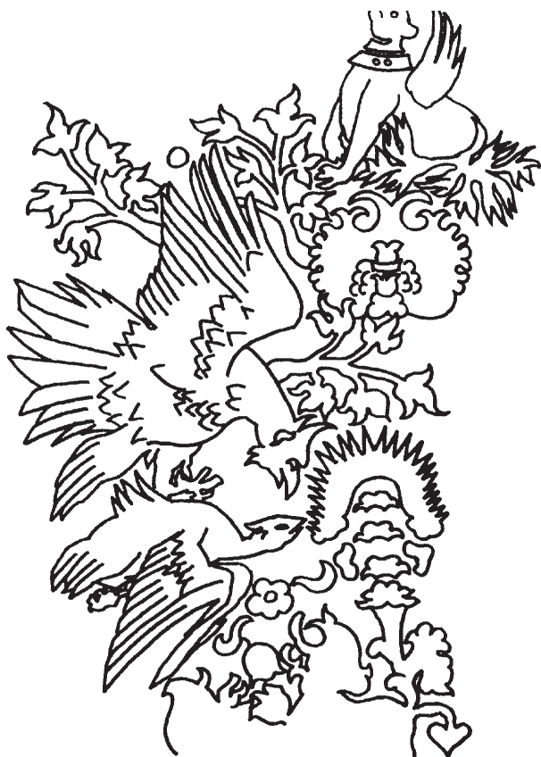
Ryc. 1. Rekonstrukcja fragmentu ornamentu o tematyce zoomorficznej. Górna kwatera awersu prawego skrzydła tryptyku z Łącka

w jakim stopniu moja rekonstrukcja jest poprawna (patrz ryc. 1).