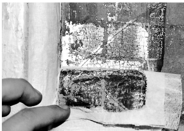
Fot. 5 (p4Mm) i 6 (p2Mm)

Próba (p4Mm) 7 w trakcie nieudanego rozwarstwiania w górnej kwaterze awersu.