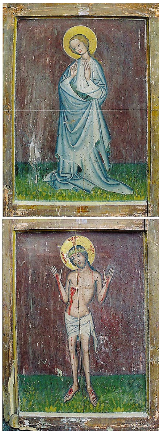
Fot. 2. Rewers prawego skrzydła tryptyku z Łącka. Kwaterna górna: Maria. Kwaterna dolna: Chrystus Bolesny

go prawe skrzydło XV-wiecznego tryptyku, z XVII-wiecznym przedstawieniem św. Wacława. Skrzydło dwustronnie malowane, podzielone na cztery kwatery, pierwotnie pochodzące z II ćw. XV wieku, wykonane w technice tempery tłustej, zostało przemalowane od strony awersu w I poł. XVII wieku, w technice olejno-żywicznej. Efektem przemalowania było zlikwidowanie podziału kwater, czyli środkowej listwy ramy obiektu i umieszczenie po-