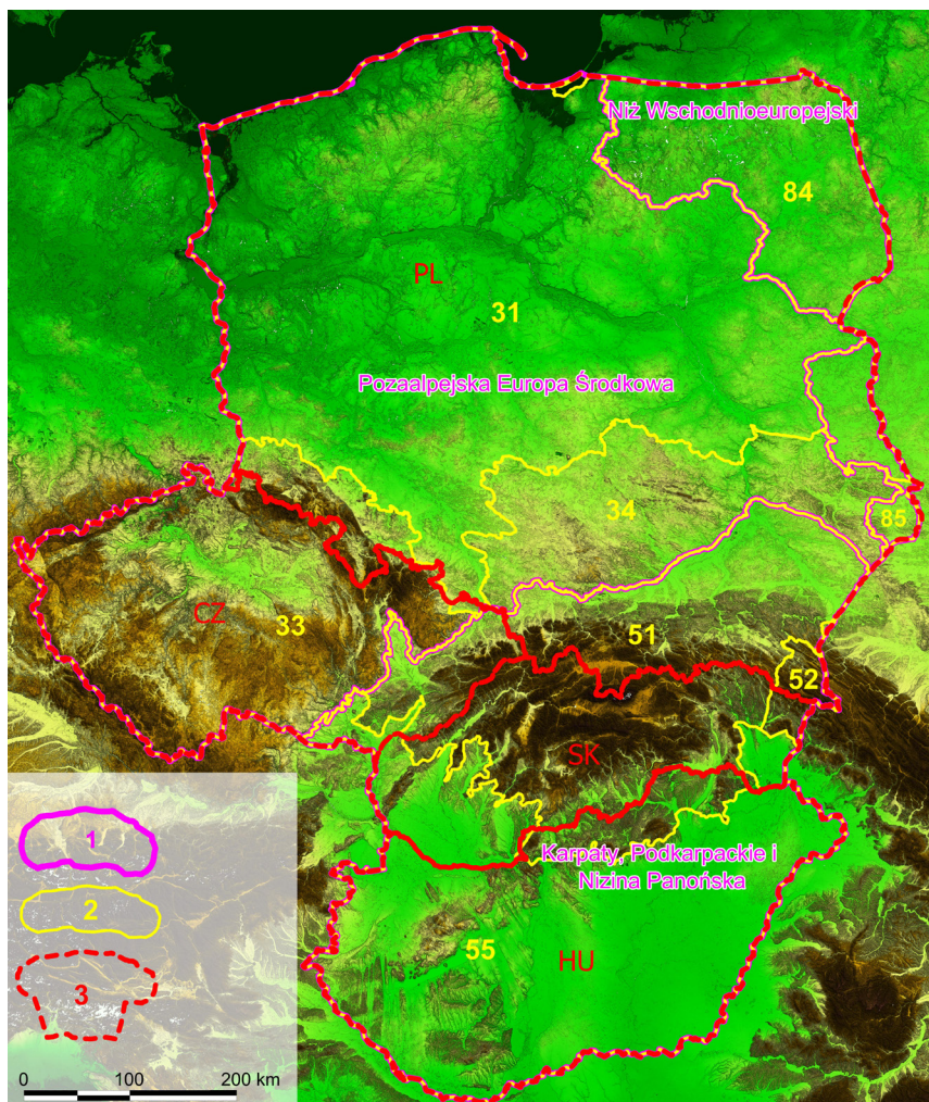
Legenda: 1 – granice megaregionów, 2 – granice prowincji, 3 – granice państw Legend: 1 – megaregion boundaries, 2 – provincial boundaries, 3 – state boundaries

w analizie znalazły się obszary chronionego krajobrazu, w Polsce reprezentowane przez parki krajobrazowe. Polska jest jedynym krajem z czterech analizowanych, gdzie wielkopowierzchniowe obszary ochrony krajobrazu podzielono na parki krajobrazowe, mające wyższą rangę w systemie ochrony i obszary chronionego krajobrazu, mające rangę niższą. Te ostatnie formy nie były brane pod uwagę ze względu na brak cech porównywalnych z obszarami chronionego krajobrazu w Czechach, na Słowacji i Węgrzech. Tworzone są w Polsce dla ochrony korytarzy ekologicznych lub obszarów