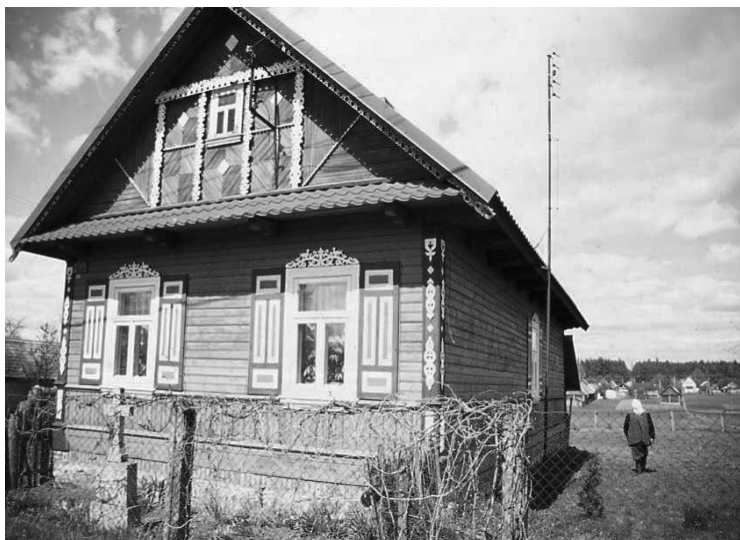
Fot. 1. Tradycyjne drewniane budownictwo bogato zdobione typowe dla „Krainy Otwartych Okiennic”. (fot. J. Plit).

Zbiera się i spisuje lokalną gwara (jest to interesujące, gdyż jest to obszar pogranicza gdzie styka się gwara ukraińska i gwara białoruska języka polskiego), archeolodzy usiłują odnaleźć ślady przeszłości, a artyści poszukują inspiracji twórczych w krajobrazie kulturowym (Stepaniuk, 2008; Stepaniuk, Gawęł, 2006). Rozpoczął się proces wykupywania i restaurowania opuszczonych zagród.