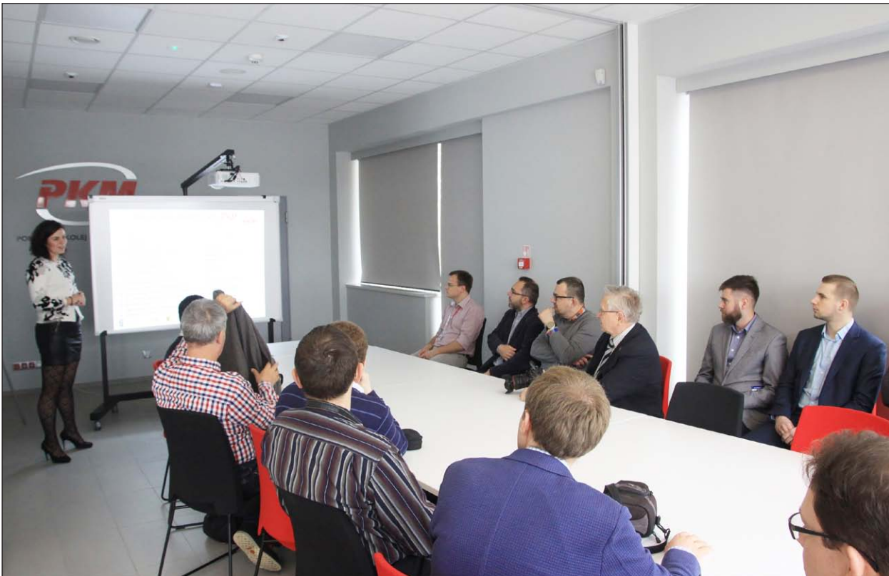
Ryc. 3. Prezentacja funkcjonowania Pomorskiej Kolei Metropolitalnej w Gdańsku przez pracowników PKM S.A. w siedzibie spółki (7.04.2017)