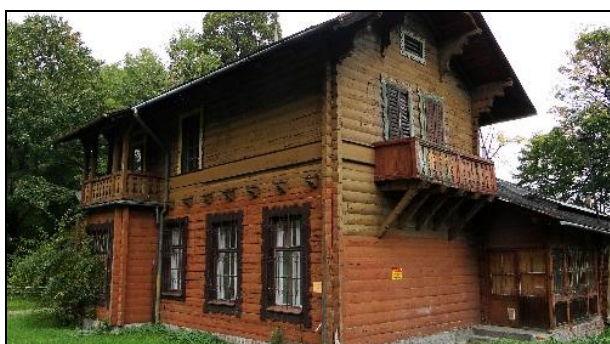
Fot. 1. Przykłady architektury willowej "cottage" w Olszówce Dolnej i Górnej. Od góry: willa przy ul. Laskowej 38 z 1899 r., willa przy ul. Laskowej 54 z 1890 r., willa przy ul. Olszówka 102 z 1892 r.

Photo 1. Examples of villa buildings in "cottage" style of Olszówka Dolna and Górna districts. From the top: villa at 38 Laskowa street built in 1899, villa at 54 Laskowa street built in 1890, villa at 102 Olszówka street built in 1892.