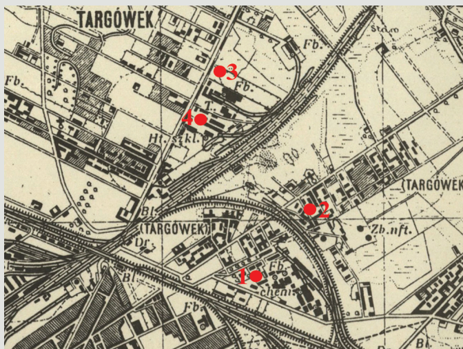
Rys. 4. Huty szkła na (pod)warszawskim Targówku. Jako podkładu użyto fragmentu mapy wydanej w 1944 r., wykorzystującej treść kartograficzną Mapy Szczegółowej Polski (arkusz Warszawa-Praga, skala 1: 25000), wydanej przez Wojskowy Instytut Geograficzny w latach 1929–1939 [43]. Na mapie tej oznaczono opisowo fabrykę chemiczną Kijewski-Scholtze oraz Hutę i Rafinerię Szkła „Targówek”.