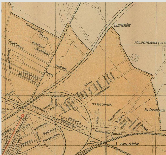
Rys. 3. Obszar Targówka Fabrycznego na planie Warszawy z 1919 r.: Plan Stołecznygo m. Warszawy . Nakład Towarzystwa Doraźnej Pomocy Lekarskiej. 1919. Podziałka 1: 25000 [42].

w czasie gdy powstała tam pierwsza huta szkła, znajdował się on poza granicami administracyjnymi Warszawy [5]. Z kolei w dwudziestolecium międzywojennym, kiedy utworzono tam inne z omawianych tu czterech zakładów, Targówek Fabryczny znajdował się już w granicach miasta. W jego obszar włączony został bowiem w 1916 r. [6] (rys. 3). Stąd użycie w tytule artykułu formy „(pod)warszawski”, jest uzasadnione w kontekście szkicu historii hut szkła na omawianym obszarze. Forma ta uwzględnia istotne zmiany, jakie zaszły w historii tego obszaru oraz obiektów na nim umiejscowionych.