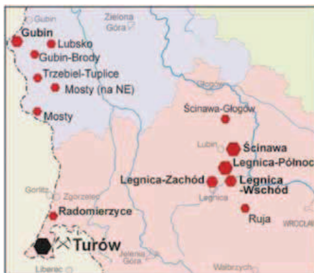
Rys. 4. Rejon legnicki występowania węgla brunatnego [Opracowanie własne]

Kompleksowe prace studialne dla określenia możliwości zagospodarowania kompleksu złożowego Legnica-Ścinawa zostały podjęte przez Państwowy Instytut Geologiczny we współpracy z Centralnym Biurem Projektów Górnictwa Odkrywkowego Poltegor w latach 1995-1997. Prace te realizowano na zlecenie KGHM Polska Miedź S.A., który był zainteresowany możliwościami pozyskania energii elektrycznej dla potrzeb górnictwa rud miedzi w perspektywie wykorzystania tzw. złoża głębokiego, położonego poniżej 1000 m ppt. Badania te objęły swoim zakresem zarówno problematykę budowy geologicznej, wielkości zasobów i jakości węgla brunatnego, jak i zagadnienia udostępnienia górniczego złóż przy szerokim uwzględnieniu potrzeb w zakresie ochrony środowiska naturalnego. Położenie złóż legnickich pokazano na rysunku 4.