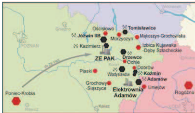
Rys. 2. Lokalizacja złoża Poniec-Krobia na tle zagłębia adamowskiego i konińskiego [Opracowanie własne] Fig. 2. Poniec-Krobia brown coal deposit location in the background of Adamów and Konin fields [Own elaboration]