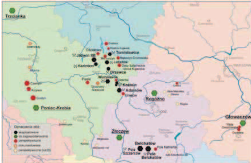
Rys. 1. Lokalizacja złóż węgla brunatnego w regionie centralnej Polski poddanych szczególowej analizie dla ewentualnego zagospodarowania [Opracowanie własne] Fig. 1. Location of brown coal deposits in Central Poland analyzed for future development [Own elaboration]