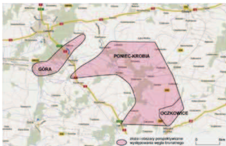
Rys. 3. Obszar złoża Poniec-Krobia i Oczkowice [Opracowanie własne na podstawie PIG Urbański P.] Fig. 3. Area of Poniec-Krobia and Oczkowice deposits [Own elaboration according to PIG Urbański P.]