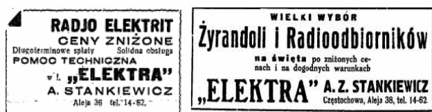
Rys. 2. Reklamy, źródło: Goniec Częstochowski od lewej: 1935, Rok XXX, nr 299 z 28 grudnia, s. 9; 1938, Rok XXXIII, nr 295 z 25 grudnia, s. 15