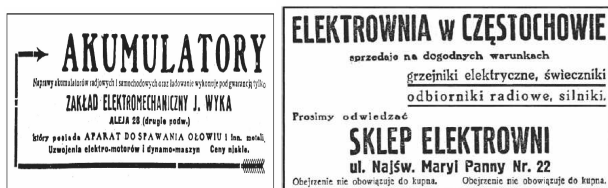
Rys. 9. Reklama, źródło: Gonicz Częstochowski, od lewej: 1932, R. XXVII, nr 42 z 21 lutego, s. 6; 1939, R. XXXIV, nr 122, s. 5