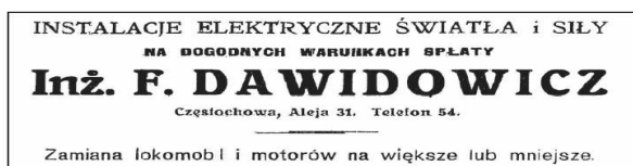
Rys. 1. Reklama źródło: Przegląd Handlowo-Przemysłowy 1927/28, Częstochowa 1927, s. 3