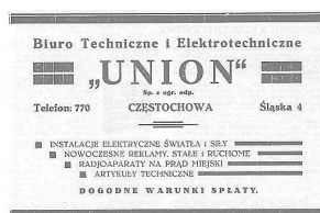
Rys. 5. Reklama, źródło: Miesięcznik Propagandy Elektryczności „Prąd” (Częstochowa), 1930, Nr 2, styczeń-luty, s. 9