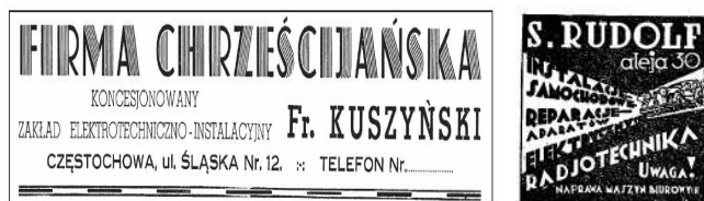
Rys. 8. Od lewej: Nagłówek druku firmowego (w zbiorach autora); Reklama, Goniec Częstochowski 1935, R. XXX, nr 298 z 25 grudnia, s. 12

• Koncesjonowany Zakład Elektrotechniczno-Instalacyjny Fr. Kuszyński, Firma Chrześcijańska w Częstochowie (ul. Śląska 12) – wykonywała instalacje elektryczne siły i światła z powierzzonego materiału (rys. 8).