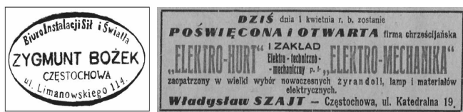
Rys. 7. Od lewej: Pieczęć owalna instalatora Zygmunta Bożka; Reklama

• Biuro Instalacji Siły i Światła Zygmunt Bożek w Częstochowie (ul. Limanowskiego 114) – wykonywało naprawy sprzętu elektrycznego oraz instalacje domowe i przemysłowe (rys. 7).