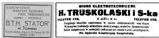
Rys. 4. Od lewej: Jednostronny druk reklamowy formatu wizytówki, Biura Techniczno-Handlowego „Stator” w Częstochowie (zbiory autora); reklama, źródło: Goniec Częstochowski 1921, Rok. XVI nr 205, z 30 września, s. 3

przyjmowała wszelkie zlecenia wchodzące w zakres elektrotechniki, wykonywała instalacje oświetlenia elektrycznego, silników elektrycznych (motorów) oraz dynamomaszyn. Posiadała składy zaopatrzone w tanie materiały elektryczne, a kosztorysy prac wykonywała bezpłatnie (rys. 4).