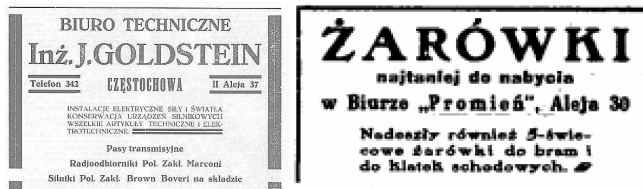
Rys. 3. Reklamy, od lewej źródło: Miesięcznik Propagandy Elektryczności „Prąd” (Częstochowa), 1930, Nr 2, styczeń-luty, str. 10; Goniec Częstochowski 1926, Rok XXI, Nr 88, 11 kwietnia s. 6