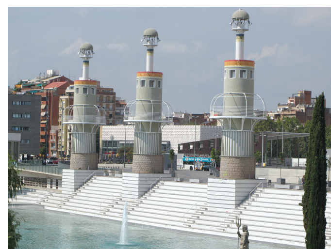
Il. 14. Tworzące rytm elementy wertykalne odwołują się zarówno do przemysłowych, jak i morskich tradycji Barcelony – fot. autor / Rhythm-forming vertical elements make a reference to industrial as well as maritime traditions of Barcelona – photo: the Author Il. 15. Pasarella łącząca dworzec z centrum dzielnicy Sants umożliwia wgląd do Parc de l’Espanya Industrial – fot. autor / A pasarella linking the railway station with the centre of the district of Sants allows to see Parc de l’Espanya Industrial – photo: the Author

In the initial design of the extension, one can observe a very big role of green areas – numerous parks (also riverside parks, especially in the area of the mouth of the Besòs river), as well as green interiors of urban quarters, in the process of shaping of the composition of the city. Regarding greenery as an element building the spatial structure of cities was another innovative contribution of Cerdà, similarly underestimated, in the development of the contemporary urban planning, many decades ahead of the visions by Howard or Le Corbusier and the urban planning manifestos of the modern movement that followed them 17 . Water in its decorative form was planned in some of such green areas, which according to the designer’s intentions was to build in the mid-19 th century the tissue of ‘the Barcelona of the future’ 18 . Sculpted fountains and ponds accompany piazzas, some have been placed in the most important hubs of the city, on junctions of the main urban axes 19 . During the period of 160 years of the plan implementation many of its initial assumptions got blurred and others were never implemented at all. Consequently, Barcelona is a compact city, with one of the highest plot ratios amongst European