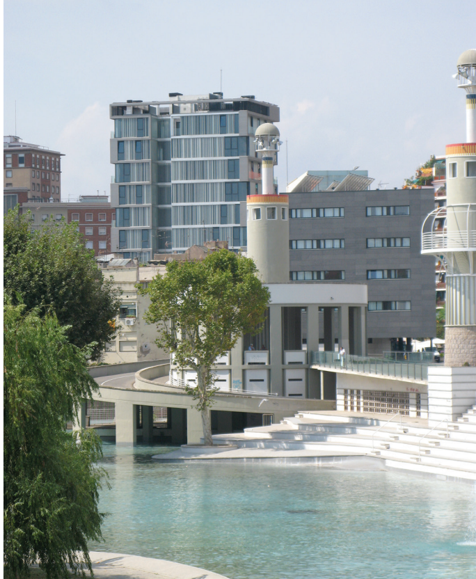
Il. 16. Elementy związane z komunikacyjną obsługą dworca udało się umiejętnie zintegrować z parkowym założeniem wodnym / Elements providing access to the railway stations have been successfully integrated with the water feature in the park

palm, które obecnie po ponad stu latach stały się domem dla sprowadzonych do Barcelony w drugiej połowie XX wieku z Argentyny papug 25 , których populacja w mieście wciąż wzrasta. W katalońskim klimacie, i tak wilgotniejszym od tego panującego w centralnej i południowej Hiszpanii, duże akweny wodne należą do rzadkości. Zrealizowane w parku staw (oferujący przejażdżki łódką) i kaskada z monumentalną fontanną 26 stały się więc synonimem luksusu i wysokich możliwości technologicznych katalońskiej myśli inżynierskiej. Stanowiły one bardzo dużą atrakcję na przełomie stuleci i do dzisiaj należą do najbardziej charakterystycznych i najczęściej fotografowanych przez turystów miejsc w Parc de la Ciutadella. W parku znajduje się kilka charakterystycznych obiektów, zaprojektowanych przez czołowych twórców epoki, które zostały po Wystawie 27 , czy też świadczących o wcześniejszej, militarnej historii miejsca, które wciąż pełnią ważne funkcje 28 . Od lat 40. XX wieku południową i wschodnią część parku zajmuje ogród zoologiczny, wówczas jeden z najnowocześniejszych w Europie 29 .