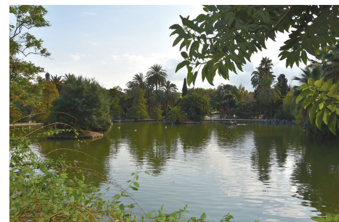
II. 7. Wielki staw w Parc de la Ciutadella / Large pond in Parc de la Ciutadella