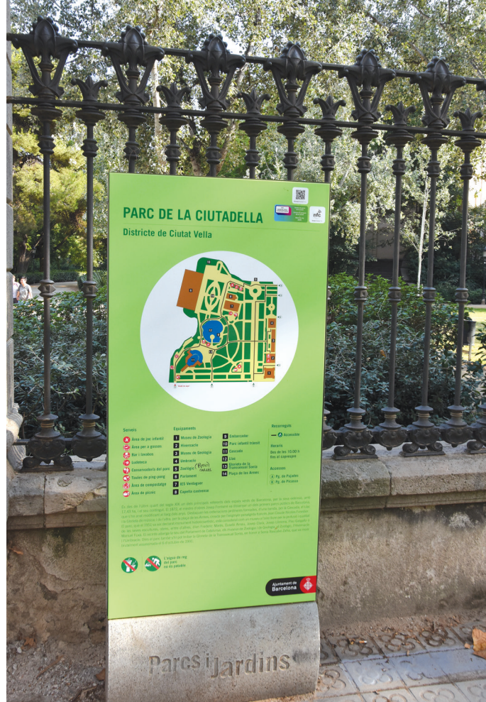
II. 2. Współczesny plan Parc de la Ciutadella przy jednym z wejść (bez terenu ogrodu zoologicznego) / Contemporary map of Parc de la Ciutadella at one of the entrances (without the territory of the zoological garden)