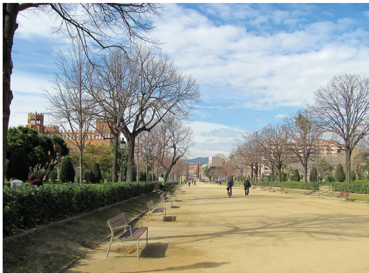
II. 3. Główna oś parku, a zarazem założenia Wystawy Światowej – widok w kierunku Arc de Triomf / The main axis of the park, and at the same time of the World's Fair complex – view towards Arc de Triomf