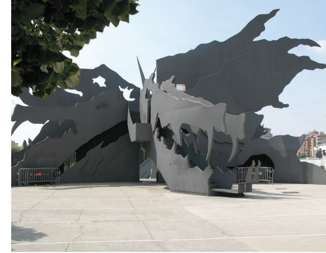
Il. 12. Fontanny są miejscem nieformalnych zabaw młodzieży (wrzesień 2012) – fot. autor / Fountains are a place of informal past times of young people (September 2012) – photo: the Author Il. 13. Zjeżdżalnia w kształcie smoka – fot. autor / Dragon-shaped slide – photo: the Author