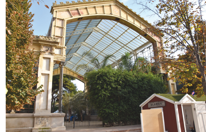
II. 4. Jeden z dawnych pawilonów wystawowych- oranżeria Hivernacle / One of the former fair pavilions –Hivernacle orangery