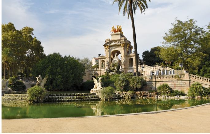
Il. 8. Kaskada wodna w północnym narożniku Parc de la Ciutadella / Water cascade in the northern corner of Parc de la Ciutadella Il. 9. Detal kaskady / Detail of the cascade