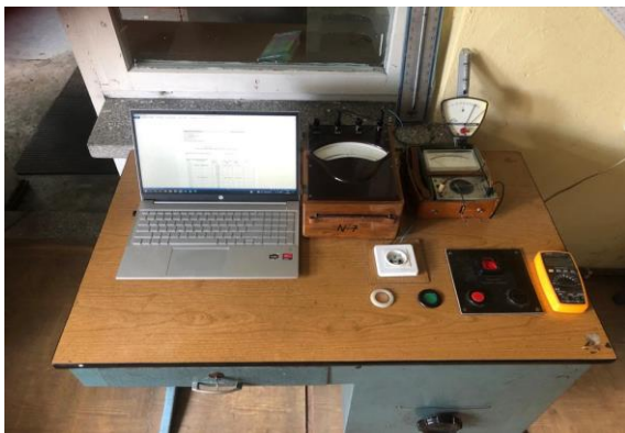
Rys. 2. Pulpit regulacyjno – pomiarowy