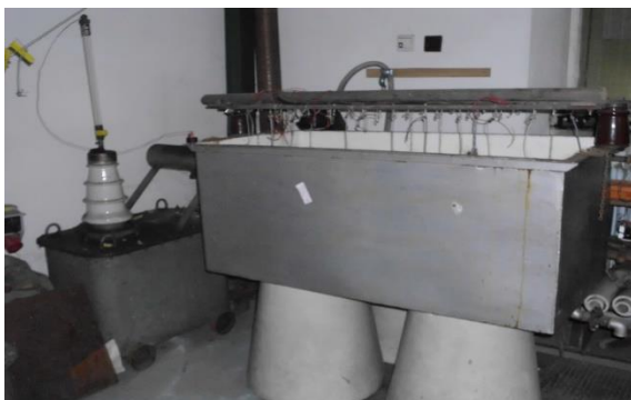
Rys. 3. Wanna wysokonapięciowa i transformator probierczy TP