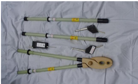
Rys. 6. Drążki izolacyjne i narzędzia wymienne

Wskaźniki pojemnościowe napięcia są zakładane na drążek izolacyjny i dotykając do wanny pod napięciem sprawdza się ich działanie. Neonowe uzgadniacze faz zakłada się na drążek izolacyjny, jeden przewód uziemia się a drugim dotyka się do wanny do której dołączone jest napięcie. Drążki izolacyjne, kleszcze i chwytaki sprawdza się zanurzając końcówkę napięciową w wodzie w wannie, a rękojęść uziemia się.