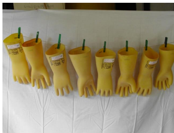
Rys. 4. Suszenie rękawic po badaniach

Sprawdzenie wytrzymałości elektrycznej sprzętu ochronnego bhp przeprowadza się napięciem przemiennym 50 Hz o wartości skutecznej napięcia podanej w metryczce badanego sprzętu. Jeśli przy tym napięciu prąd upływu przekracza wartość, standardowo 10 mA, to napięcie dopuszczalne dla tego sprzętu odpowiednio obniża się. Sprzęt dielektryczny: rękawice dielektryczne, obuwie dielektryczne, narzędzia elektroizolacyjne, jest badany na mokro w wannie wysokonapięciowej. Procedury badawcze są opisane w instrukcjach badań, które zostały opracowane w Laboratorium. Instrukcje są oparte na normach wymienionych w tabeli 1 i w spisie literatury.