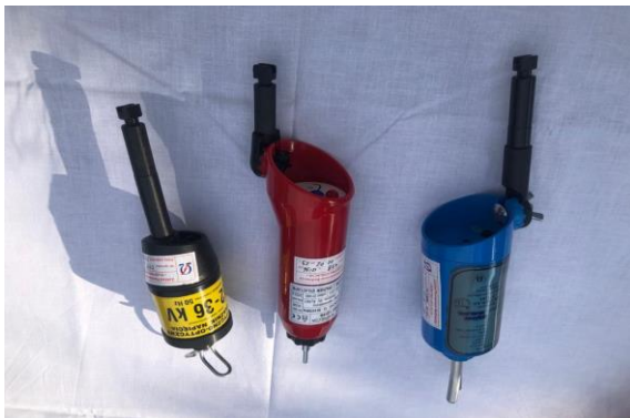
Rys.7. Wskaźniki pojemnościowe napięcia

Uziemiacze wymagają innej procedury badawczej. Uziemiacze mają znamionowaną wartość prądu od 6 kA do 31,5 kA, jest to prąd jednosekundowy. Badanie uziemiacza przy tym prądzie nie jest możliwe, gdyż uziemiacz niepotrzebnie byłby przegrzewany. W Laboratorium opracowano procedurę badań, która obejmuje: