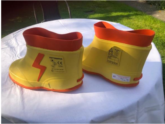
Rys. 5. Półbuty po badaniach

nie ma przebicia. Pomosty izolacyjne ustawia się na metalowej płycie i podobnie jak dywaniki szczotką drucianą sprawdza się powierzchnię górną pomostu.