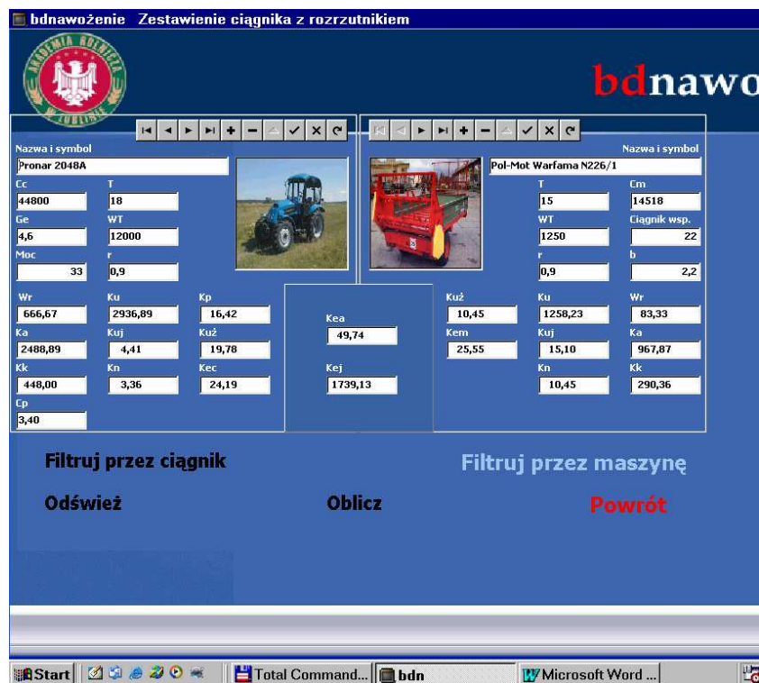
Rys. 4. Widok ekranu opisującego moduł zestawiania agregatu ciągnik + rozrzutnik obornika