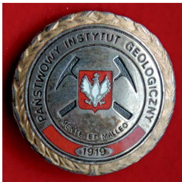
Ryc. 1. Złota Odznaka Państwowego Instytutu Geologicznego.