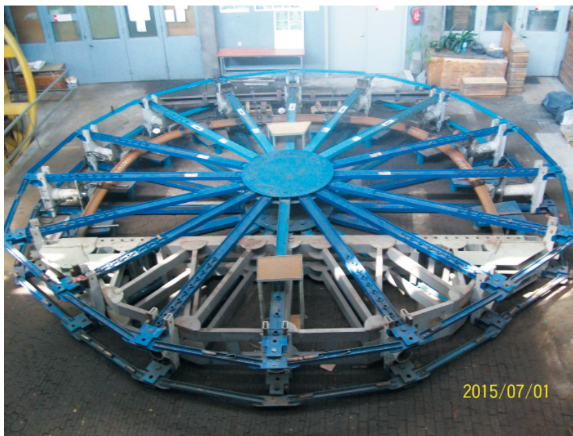
Fot. 5. Stanowisko do badań obudów górniczych