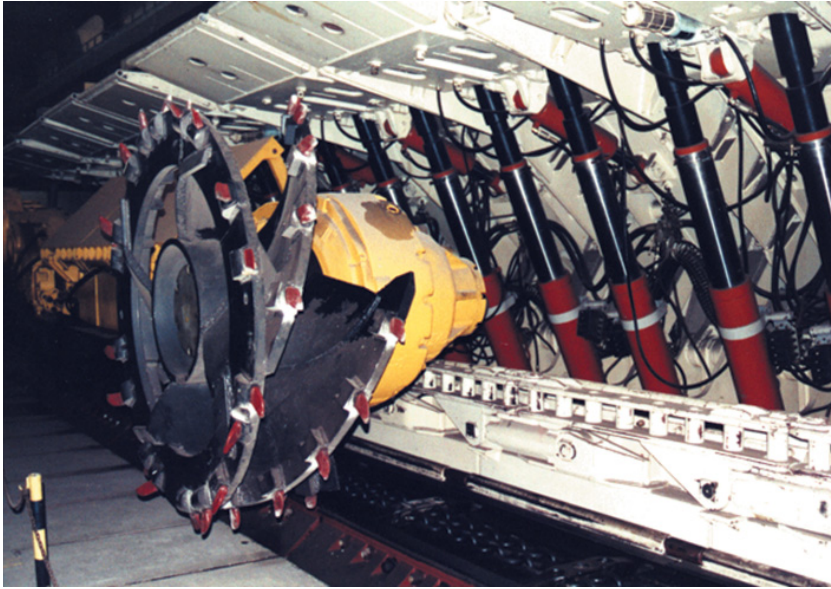
Fot. 3. Ścianowy kompleks zmechanizowany