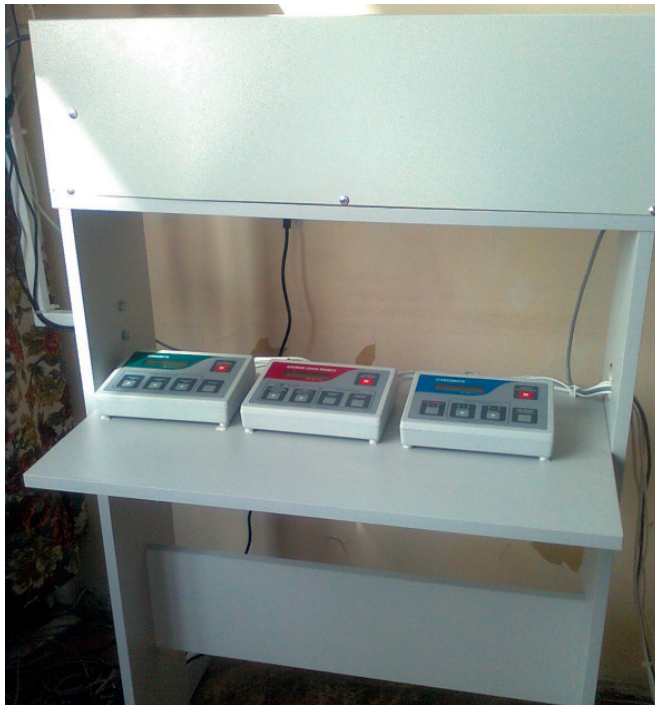
Fot. 4. Panele sterownicze stereometru Dolmana, wirometru oraz miernika czasu