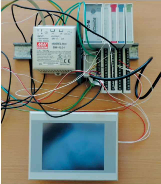
Fot. 1. Komputer panelowy