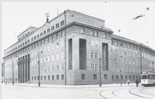
Fot. 1. Widok gmachu od strony północno-zachodniej, fot. archiwalna ABMW, t. IV/37 sygn. 899.

W 1925 r. powstały ostateczny plan funkcjonalny obiektu, opracowany przez Ministerstwo Spraw Wewnętrznych oraz dwa szkice koncepcyjne bryły i elewacji. Rada Miejska wybrała do realizacji projekt autorstwa Rudolfa Fernholza (szkice powstały we współpracy z rządowym mistrzem budowlanym J. Maltrizem) 5 z niezwyklej obrysem