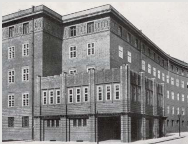
Fot. 2. Widok gmachu od strony południowo-wschodniej, fot. archiwalna, ABMW, t. IV/37 sygn. 18604.

gabarytu. Obiekt został założony na planie nieregularnego trapezu o łagodnie, łukowo wygiętych bokach – wklęsłym wschodnim i wypukłym zachodnim.