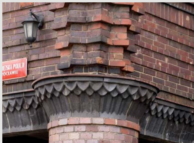
Fot. 7. Fragment dekoracji kapitela – portal w północno-zachodnim narożniku.

zdobią potężne terakotowe płyciny w odcieniach zbliżonych do różu indyjskiego. Według źródeł ceramika portali pochodzi z obecnie nieistniejącej już cegielni w Ullersdorf am Queis (Odrzychów k/Bolesławca, ówczesnie jego dzielnica, dziś już nieistniejąca), jednak terakoty o identycznej barwie produkowała także klinkiernia w Nowogrodzcu 10 . Elewacja północna budynku zdecydowanie kontrastuje z czerwienią sąsiednich budynków sądu.