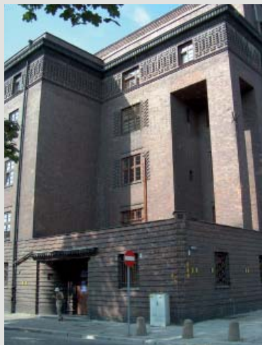
Fot. 3. Narożnik północno-wschodni w świetle porannym podkreślającym reliefy fryzów, kontrasty faktur i kolor lica muru.