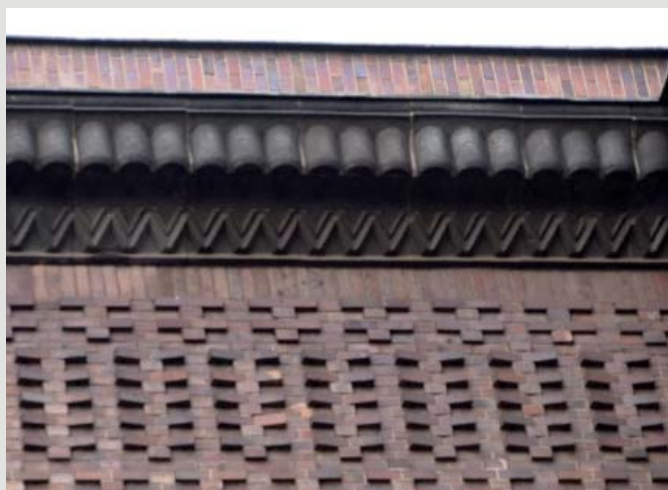
Fot. 6. Fragment fryzu obiegającego gmach na wysokości V kondygnacji.