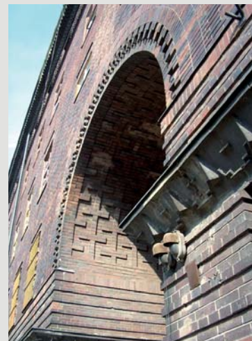
Fot. 10. Brama przejazdowa od południa – detal podłucza z dekoracją kształtkową, kostkową, fryzem z terakoty i maskami.

powierzchnowe wymiany cegieł podczas robót instalacyjnych. Stan elewacji jest bardzo dobry, pomimo stałej ekspozycji na szkodliwe czynniki atmosferyczne. Klinkierowa powierzchnia jest równomiernie pokryta miejską patyną. Miejscowe próby oczyszczenia lica i terakotowych portali ukazują doskonale zachowane barwy i strukturę ceramiki, świadcząca o wysokim poziomie technologicznym śląskich klinkierni 11 .