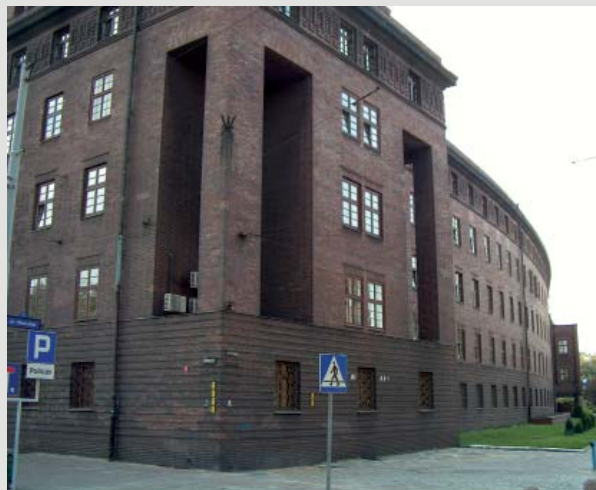
Fot. 4. Narożnik północno-zachodni w świetle podkreślającym fioletowy odcień glin ze złóż „Ilse”.