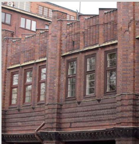
Fot. 8. Narożnik południowo-wschodni w pełnej ekspozycji światła – efekty kontrastu faktur, światłocienia na „kryształowych” formach fial i terakotowym gzymsie.