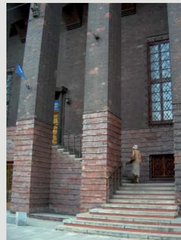
Fot. 5. Elewacja północna, fragment portyku głównego, kompozycja dwóch odcieni i kontrastowy efekt szklenia i matu flizów.