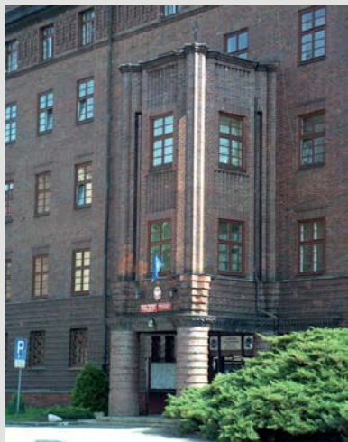
Fot. 9. Fragment portyku południowo-zachodniego w ekspozycji popołudniowej – wielość kompozycji flizów, kontrast faktur, harmonia kolorów w pełnym oświetleniu.