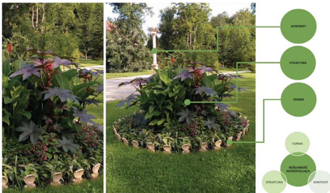
Il. 6. Rekonstrukcja XIX-wiecznego klombu liściastego typu angielskiego wraz z dekoracyjną, ceramiczną bordiurą. Lokalizacja wtórna przy Kolumnie z Orłem w Północnym Parku Krajobrazowym Muzeum Pałacu Króla Jana III w Wilanowie. Grafika: Łukasz Przybylak.

Pierwszym czynnikiem, który wyparł dziewiętnastowieczne kwietniki i klomby z przestrzeni ogro-