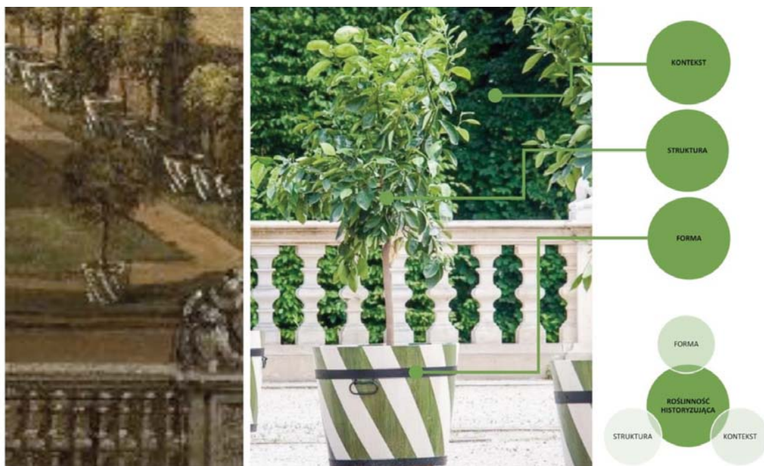
Il. 5. Element wyposażenia salonu ogrodowego na tarasie górnym przy pałacu w Wilanowie — kadr z obrazu Bernarda Bellotta Pałac w Wilanowie od strony ogrodu — 1776 w zestawieniu ze zdjęciem efektu odtworzenia historycznych pojemników na cytrusy. Weryfikacja kryteriów oceny autentyczności formy roślinności historyzującej. Grafika: Łukasz Przybylak.

Jednym z przykładów działań, mających na celu przywrócenie i utrzymanie w stanie autentycznym