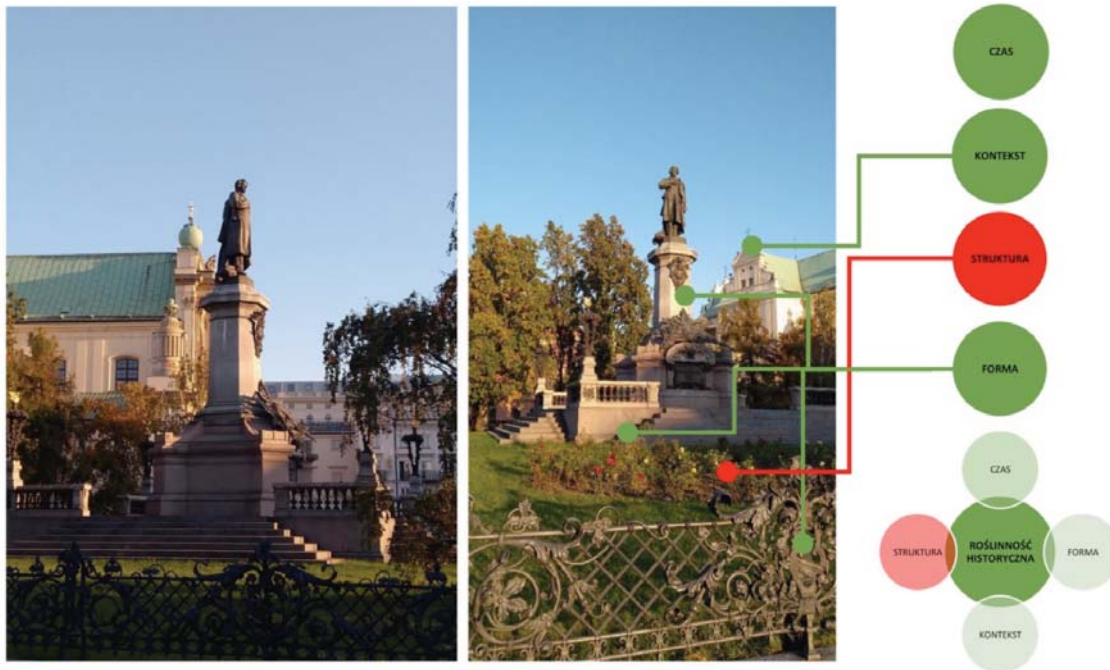
II. 2. Skwer Adama Mickiewicza w Warszawie — weryfikacja kryteriów oceny autentyczności formy roślinności historycznej.