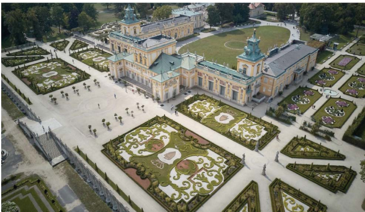
Il. 4. Widok z lotu ptaka na salon ogrodowy tarasu górnego przy Pałacu w Wilanowie. Widoczny jest także Ogród Północny przy Pałacu oraz Ogród Południowy. Stan po rewaloryzacji z lat 2009–2011 ilustruje utrzymanie przestrzennych wartości kompozycyjnych datowanych na koniec XVII wieku.

W ujęciu wartości kompozycyjnych rezydencji wilanowskiej, do poddawanych ochronie należą także te niematerialne. Pięcioliniowy układ głównych osi kompozycji przestrzennej, na które w XVII wieku nanizany został pałac oraz towarzyszące mu ogrody ozdobne i zabudowania folwarczne, przetrwał w niezmienionym stanie do czasów współczesnych. Utrzymanie osiowego układu w przestrzeni rezydencji wilanowskiej, szczególnie w obliczu XIX-wiecznej rearanżacji inicjowanej przez rodzinę Potockich, nie było oczywiste. Układ kompozycyjny utrzymał się wówczas dzięki świadomości jego wartości. Wiedziony podobnymi pobudkami profesor Gerard Ciołek przyczynił się z kolei w latach powojennych XX wieku także do zachowania przebiegu pięciu głównych osi kompozycji przestrzennej. Pochodną