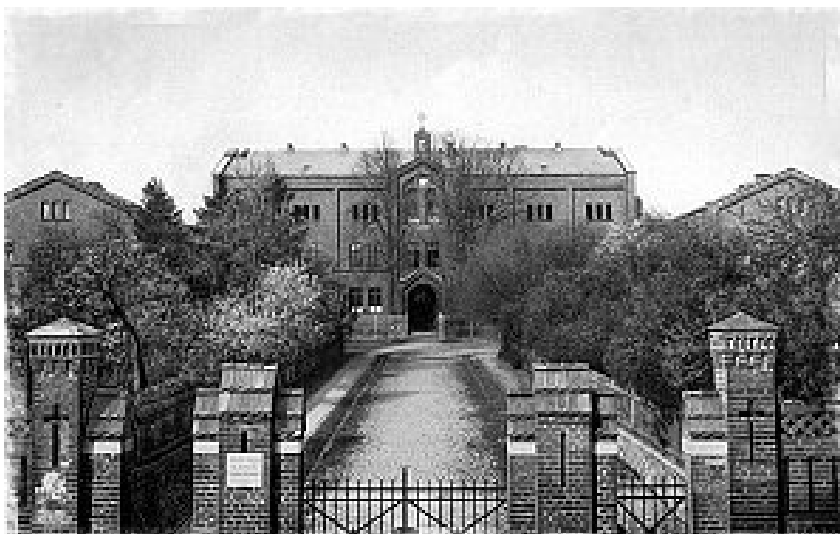
Fig. 3. The Royal Evangelical Teachers' Seminar, historical photo. Source: [3]

Ryc. 3. Królewskie Ewangelickie Seminarium Nauczycielskie, zdjęcie historyczne. Źródło: [3]