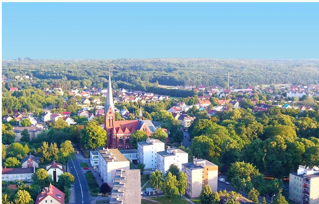
Fig. 6. The new St. Mary's Church in the panorama of the city. Ryc. 6. Nowy kościół Mariacki w panoramie miasta.

During World War II, the roof was destroyed, but after the war it was rebuilt. The interior of the church has been plundered.