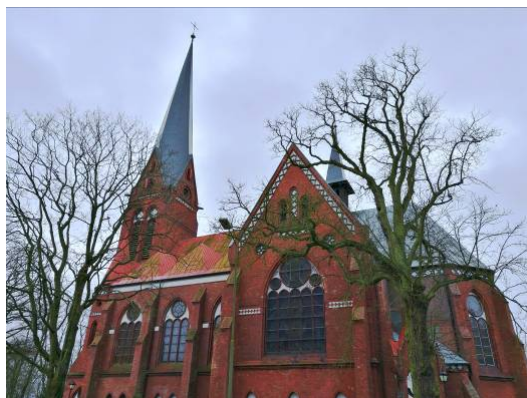
Fig. 6. The new St. Mary's Church.

Ryc. 6. Nowy kościół Mariacki.