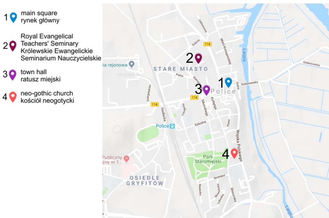
Fig. 1. Location of the discussed objects on the map.

In the 19th century the purpose of new buildings were: public, sacred and residential. The brick buildings completed in the 19th century are: St. Jürgen's hospital, a primary school, the complex of Royal Evangelical Teachers' Seminary, St. Jürgen Hospital, which was built in 1827, was located on the Hospital Street, current name School Street. (Fig.1)