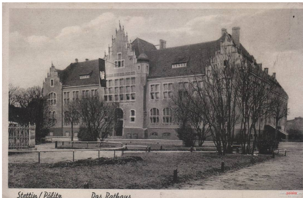
Fig. 5. City hall in Police, historical photo. Source: [1]

Currently, the city hall does not exist, it was bombed on January 13, 1945 during an air raid on Police, and the remaining ruins were demolished.