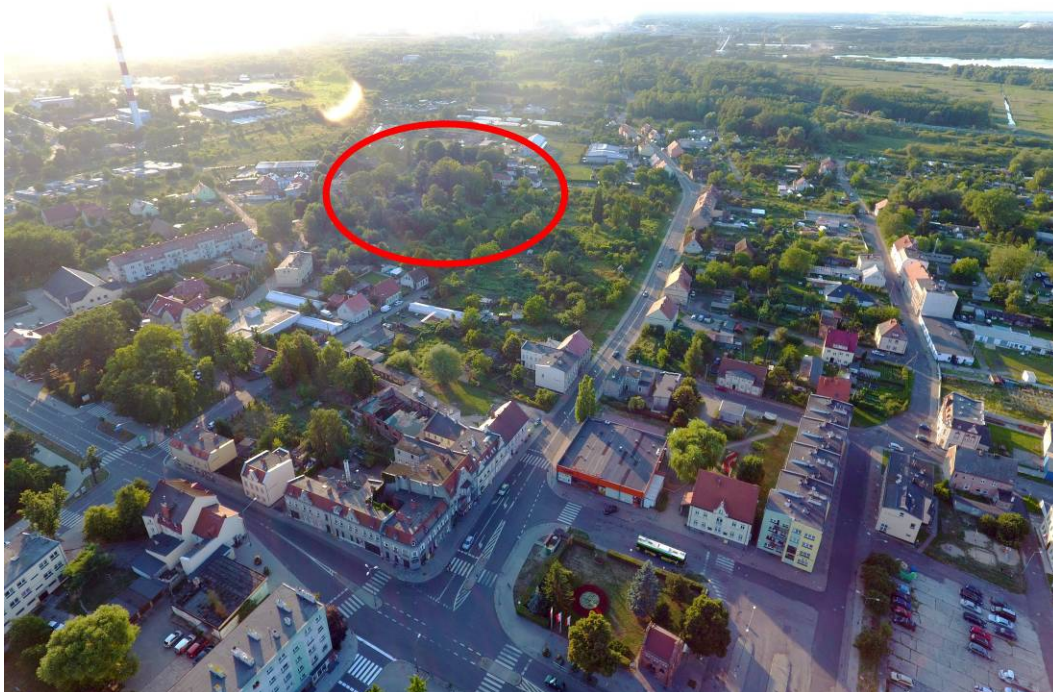
Fig. 4. Place after The Royal Evangelical Teachers' Seminar.

In 1922 in the building of the Seminary a high school named after J. Bugenhagen was placed. The object was bombed in 1944. After the war, despite significant damage, the school existed and in 1947 the first class of the elementary school in Police was set up in its walls. In 1948, the buildings were demolished by decision of the architect of Szczecin. [4] A brick from the school was used to rebuild the capital of Poland. At present, there is greenery in the area of the former seminary (Fig. 4), and only memories have remained after the buildings.