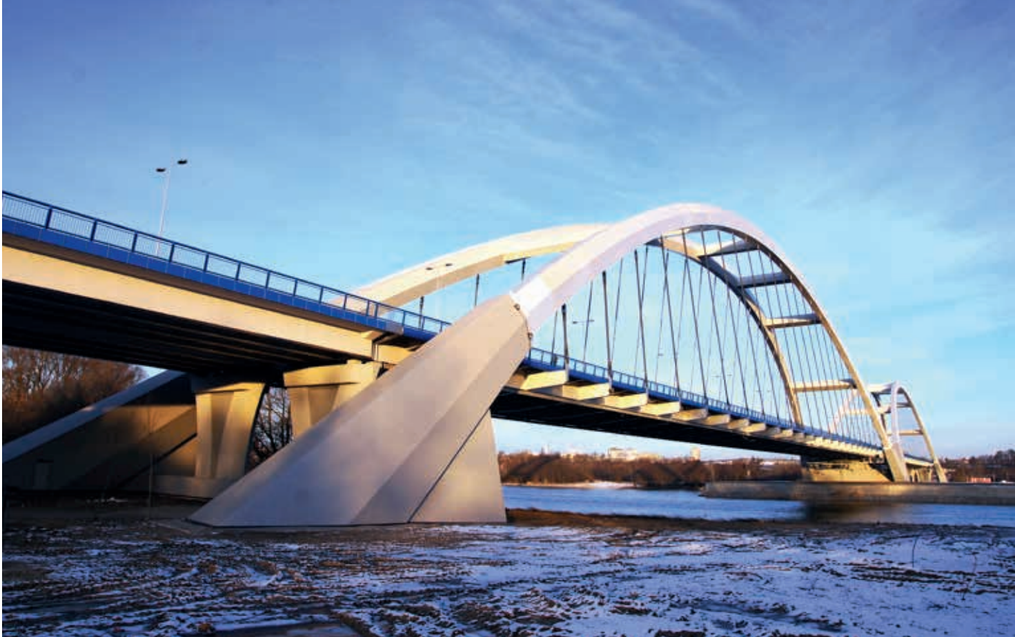
Most im. gen. Elżbiety Zawackiej w Toruniu, fot. 2013

linii kolejowych w Polsce. Bierzymy udział w aktualnych przetargach ogłaszanych przez PKP PLK. Zamierzymy również uczestniczyć w dużych przetargach finansowanych przez UE, które będą ogłoszone przez PKP PLK. Jesteśmy pewni, ponieważ mamy jako koncern bardzo bogate doświadczenia w tym zakresie, że realizacja kontraktów przez STRABAG zapewni najwyższą jakość wybudowanych linii kolejowych. Także w tym segmencie zatrudniamy specjalistów potrafiących zarządzać tak skomplikowanymi inwestycjami, tj. wymagającymi wiedzy z budownictwa kolejowego, mostowego czy kubaturowego. STRABAG ma renomę firmy potrafiącej budować terminowo i przy użyciu nowoczesnego, w pełni zautomatyzowanego sprzętu. Naszą wizytówką są takie realizacje, jak np. Galeria Katowicka połączona z dworcem kolejowym i podziemnym terminalem, autobusowym tworząca jedno z najnowocześniejszych w Polsce zintegrowanych centrów komunikacyjno-handlowo-biurowych. Inwestycja ta została uznana za Budowę roku 2013 według PZITB.