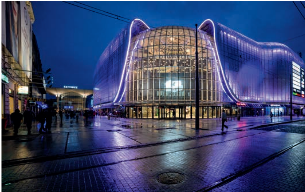
Galeria Katowicka, fot. 2013