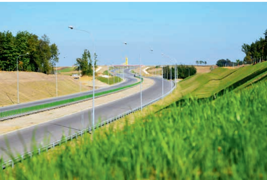
Autostrada A4, Dębica – Tarnów, fot. 2014

drogi ekspresowej S8 Opacz – Paszków z nawierzchnią długowieczną zapisze się chlubnie w historii budownictwa. Ale lista inwestycji, które napawają nas dumą, jest bardzo długa.