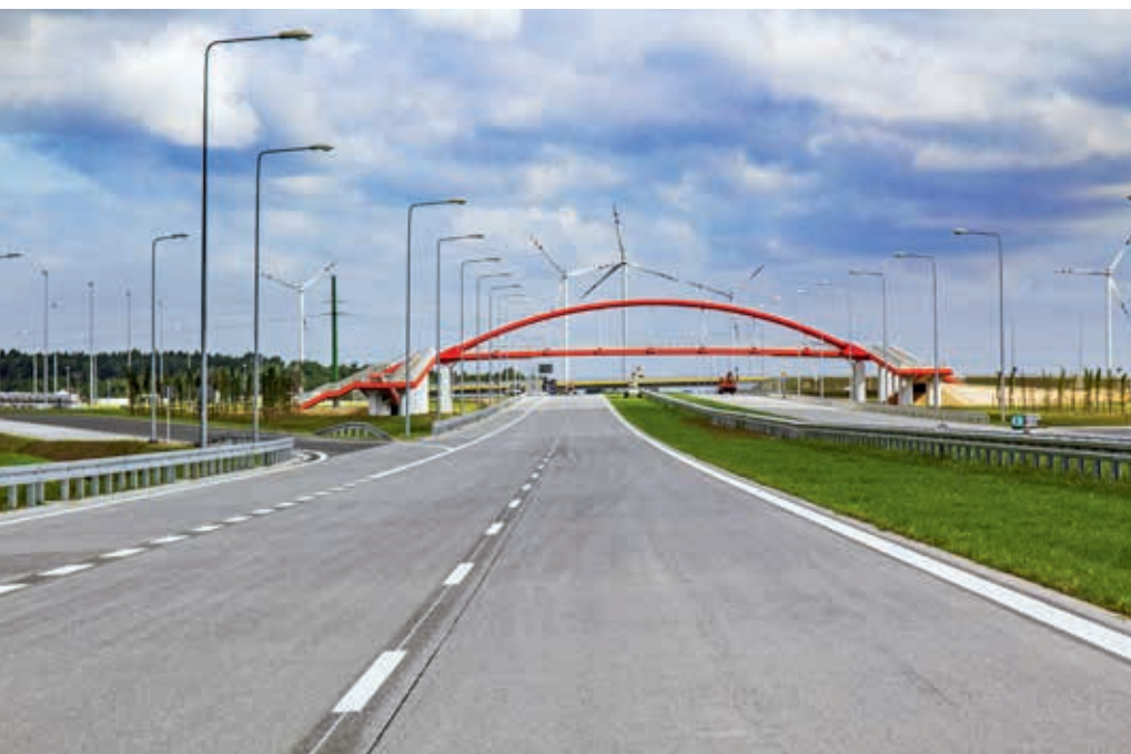
Droga ekspresowa S8, odcinek Złoczew – Sieradz, fot. 2014