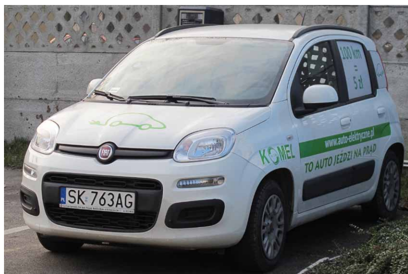
Fot. 1. Samochód Fiat Panda III zelektryfikowany zestawem E-Kit

Jako drugi pojazd do porównania emisji CO 2 wybrano samochód dostawczy Honker Cargo (dawniej DZT Pasagon) z napędem spalinowo-elektrycznym, w którym oprócz tradycyjnego silnika spalinowego zamontowano nowoczesny napęd elektryczny [6] Testy drogowe były wykonane na tej samej trasie, w tym samym dniu, z użyciem napędu spalinowego, a później z użyciem napędu elektrycznego. Pojazd obciążono ładunkiem około 1000 kg [6]. Honker Cargo został zbudowany tak, aby silnik spalinowy można było wykorzystywać do przejazdów na dłuższych odcinkach poza miastami lub poza terenami zabudowanymi, natomiast na obszarach miejskich rolę głównego napędu