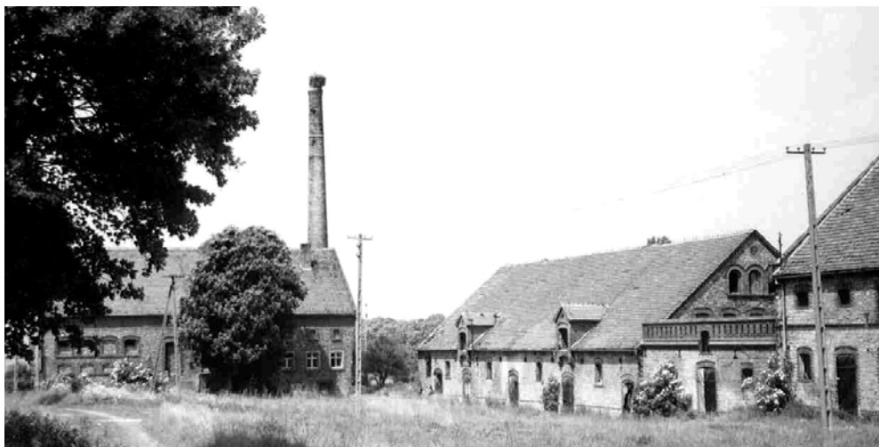
Fot. 2. Jezierzycy Małe. Widok na zabudowę gospodarczą. Photo 2. Jezierzycy Małe. The view of farm buildings.

Odmienne zagadnienie stanowią dawne posiadłości ziemskie np. w Jezierzycach Małych (fot. 2) bądź Pasterzycach, które w czasie zarządzania nimi przez PGR-y – funkcjonowały. Od momentu zmian, jakie nastąpiły po 1991 r., wspomniane zespoły stopniowo pustoszały, aż zaczęły popadać w ruinę. Jeżeli w miarę szybko nie znajdą inwestora z programem godnym ich dawnej przeszłości, mogą podzielić los przelądawickiego folwarku 5 .