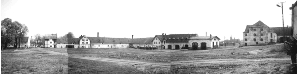
Fot. 1. Kwietno. Fragment dziedzica folwarcznego. Photo 1. Kwietno. The fragment of grange complexe.

1945 r. znacjonalizowano i utworzono w ich obrębie Państwowe Gospodarstwa Rolne. Z całą pewnością nie był to najlepszy gospodarz, ale przynajmniej przez fakt użytkowania dawnych zabudowań folwarcznych, był zmuszony do utrzymywania ich, chociaż na średnim poziomie. Pod koniec XX w., wraz z likwidacją PGR-ów, wspomniane dawne majątki ziemskie zostały zakupione przez prywatnych inwestorów, którzy nie byli zainteresowani wyłącznie eksploatacją, ale przede wszystkim odpowiednim użytkowaniem. Zaczęto od prac remontowo-naprawczych. Zabudowaniom przywrócono ich dawną świetność i zaadaptowano zgodnie ze współczesnymi zapotrzebowaniami.