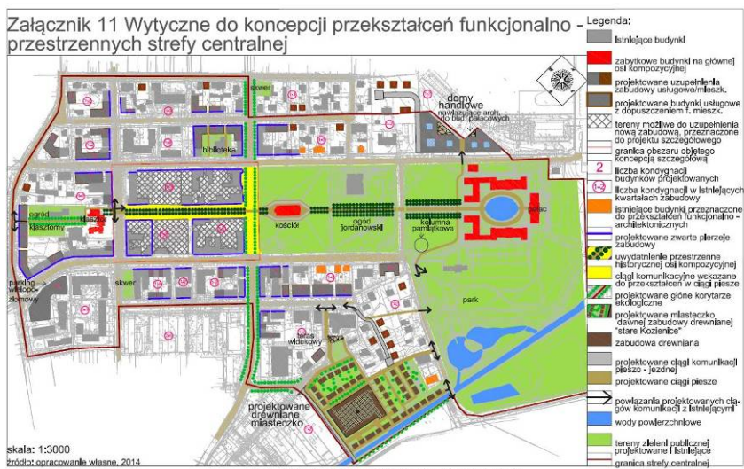
Ryc. 10. Wytyczne do zagospodarowania strefy centralnej.

Drugim pasmem przestrzeni publicznych jest struktura parkowa, gdzie w miejscu cotygodniowego targowiska zaprojektowano zespół drewnianej zabudowy, który nazwano 'drewnianym miasteczkiem'. Mogłyby zostać tu przeniesione wszystkie budynki drewniane ze strefy centralnej, których fizjonomia i stan techniczny koliduje z charakterem pozostałej zabudowy tej strefy. 'Drewniane miasteczko' mogłoby stać się miejscem unikatowym na skalę regionu, do którego przyjeżdżaliby turyści. Zamiast wybetonowanej i niezagospodarowanej powierzchni pełniącej funkcję targowiska stworzono system uliczek, placów i pierzei drewnianych parterowych domów, w których można zlokalizować usługi, dzięki czemu przestrzeń ta, w przeciwieństwie do skansenów, zostałaby 'ożywiona', a turyści mogliby zasmakować w atmosferze starych Kozienic.