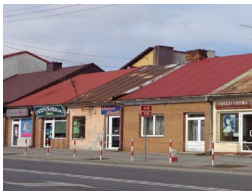
Ryc. 5. Dawna zabudowa Kozienic.

Fig. 4. The view of the palace park.