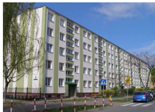
Ryc. 6. Zabudowa osiedla Energetyki.

Fig. 5. The old buildings of Kozienice.