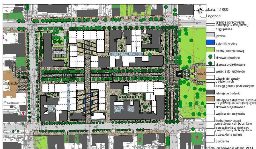
Ryc. 11. Koncepcja zagospodarowania fragmentu strefy centralnej. Źródło: [9]

Fig. 10. Guidelines of the central area development Source: [9]