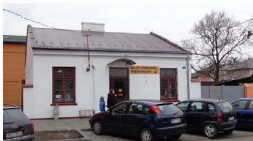
Ryc. 8. Budynek wzorcowy parterowy.

architektoniczną dla nowo projektowanych budynków postanowiono zdefiniować zabudowę wzorcową, bo Przewaga określonego typu domów w ośrodku miasteczka sama narzuca [...] rozwiązanie przyszłej architektury [1, s. 45] (ryc. 8, 9). Na podstawie przeprowadzonych analiz stwierdzono, że projektowana zabudowa powinna być niska – głównie parterowa lub dwukondygnacyjna (wyjątkowo trzykondygnacyjna). Rzut budynku – prostokątny lub kwadratowy, o fasadzie bez wykuszy, z dopuszczeniem centralnie usytuowanego balkonu na piętrze. Elewacja może zostać ozdobiona gzymsami (w poziomie parteru i pod dachem). Dach powinien być dwuspadowy, z ustawieniem kalenicowym względem ulicy. Kolorystyka elewacji ma być utrzymana w jasnych barwach – bielach, beżach, odcieniach kremowych, a dachu – w odcieniach kolorów czerwonych i brązowych. Taka zabudowa powinna tworzyć pierzeje, szczególnie wzdłuż najbardziej reprezentacyjnych ciągów. Powinno się zadbać o podziały elewacji budynków – maksymalna szerokość elewacji powinna wynosić 8–10 m zgodnie z podziałem działek.