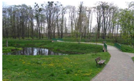
Ryc. 2. Widok parku pałacowego.

Fig. 3. The historic axis of the city.