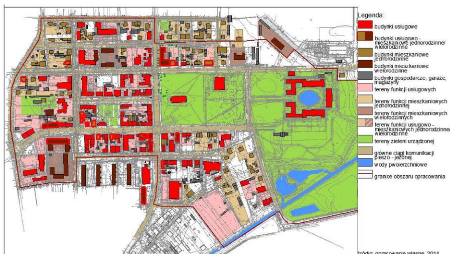
Ryc. 7. Inwentaryzacja funkcjonalna strefy centralnej. Fig. 7. Functional inventory of the central area.

Według obowiązującego SUIKZP niemal cały obszar delimitowanej strefy znajduje się w strefie ochrony konserwatorskiej (strefa A, o najwyższej ochronie, obejmująca najbardziej wartościowy układ przestrzenny z parkiem, kościołem św. Krzyża i terenem ogrodu jordanowskiego, oraz strefa B, obejmująca pozostały teren centrum). W strefie tej nakazano ochronę wszelkich historycznych elementów, które tam występują – budynków i ich układów, parku, a także układu ulicznego. W strefie B zezwala się na usunięcie obiektów, które zaburzają dawny układ urbanistyczny. Cały obszar centrum przeznaczony jest pod zabudowę mieszkaniową i usługi. W wytycznych podano, że zabudowa nie powinna być wyższa niż 15 m, ma współtworzyć z istniejącą zabudową zwarte pierzeje w miejscach, gdzie one występują, partery budynków powinny być zajęte pod funkcje usługowe, zwłaszcza przy ważnych przestrzeniach publicznych. Garaże i budynki gospodarcze powinny być budowane z dala od ciągów ulicznych, we wnętrzach kwartałów, lub stanowić integralną część zabudowy mieszkaniowo-usługowej. Istniejące zespoły zabudowy są zalecane do odnowienia.