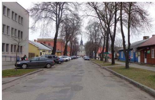
Ryc. 1. Oś historyczna miasta.

Fig. 3. The historic axis of the city.