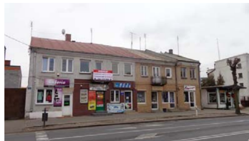
Ryc. 9. Budynek wzorcowy piętrowy (fragment pierzei ulicznej).

Fig. 8. The model ground-floor building.