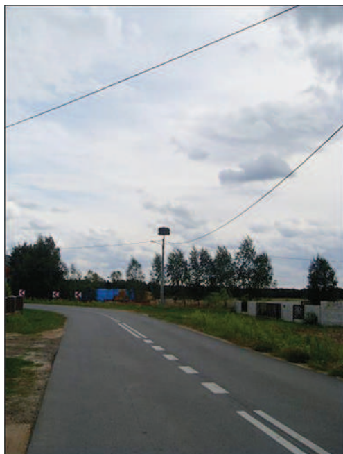
Fot. 15. Bocianie gniazdo w Przystajni Kolonii (fot. A. Krajewska, lipiec 2013 r.)