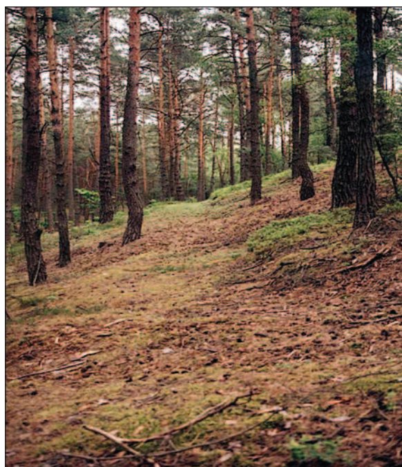
Fot. 28. Widoczny od strony północnej zarys ścieżki (mała skarpa) prowadzącej wzdłuż ustawionych w przeszłości małych krzyży symbolizujących Stacje Męki Pańskiej, (fot. Z. Małecki, czerwiec 2010 r.)