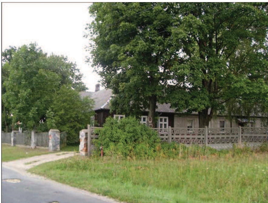
Fot. 11. Budynek dawnej szkoły w Przystajni