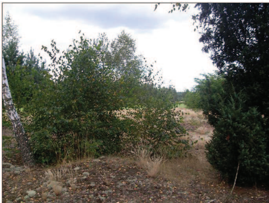
Fot. 14. Zadrzewienie śródpolne (przydrożne) w Przystajni (fot. A. Krajewska, lipiec 2013 r.)