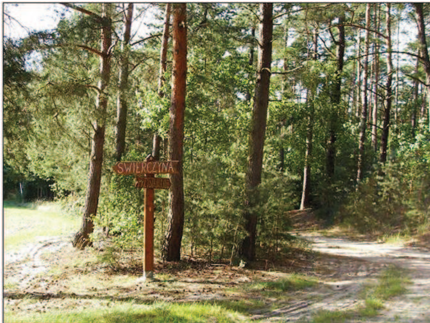
Fot. 21. Oryginalny drogowskaz w Świerzynie, w tle las sosnowy (fot. A. Krajewska, lipiec 2013 r.)