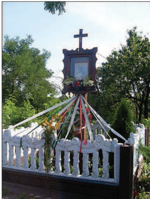
Fot. 9. Kapliczka Matki Boskiej (skrzynkowa) w Przystajni (fot. A. Krajewska, maj 2014 r.)