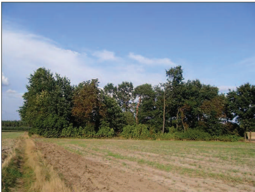
Fot. 22. Cmentarz poewangelicki w Przystajni Kolonii (fot. A. Krajewska, sierpień 2013 r.)