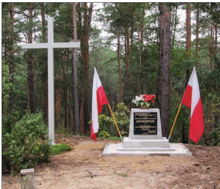
Fot. 26. Kalwaria Moczalsko-Bugajska na najwyższym wzniesieniu Moczalca (fot. Z. Staszewski, wrzesień 2013 r.)