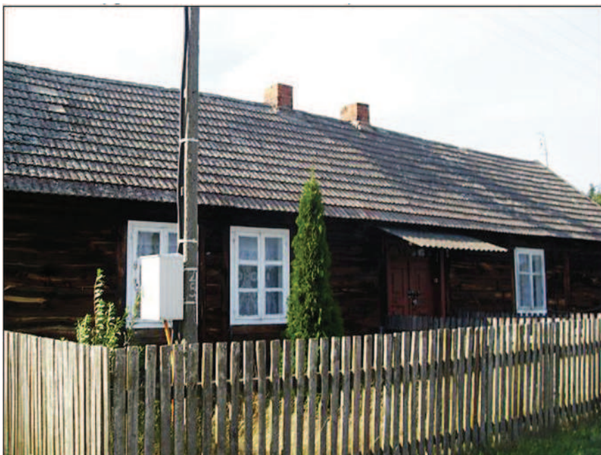
Fot. 20. Drewniany dom w Świerczynie (fot. A. Krajewska, lipiec 2013 r.)