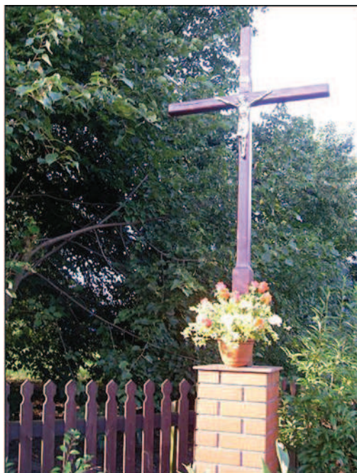
Fot. 24. Krzyż przydrożny na Bugaju na posesji Państwa Rosów