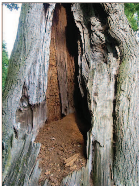
Fot. 6. Próchniejący pień dębu w parku w Przystajni (fot. A. Krajewska, czerwiec 2014 r.)