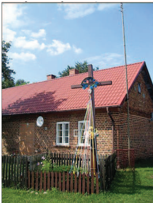
Fot. 10. Krzyż przydrożny na posesji Państwa Bijacików (fot. A. Krajewska, maj 2014 r.)