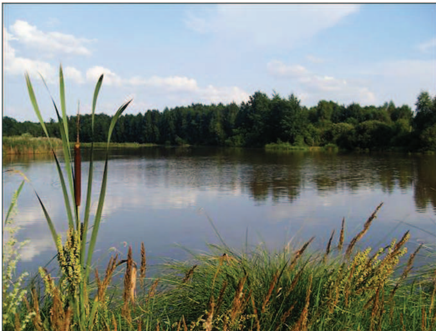
Fot. 19. Stawy potorfowe – torfowisko „Świerczyna” (fot. A. Krajewska, lipiec 2013 r.)