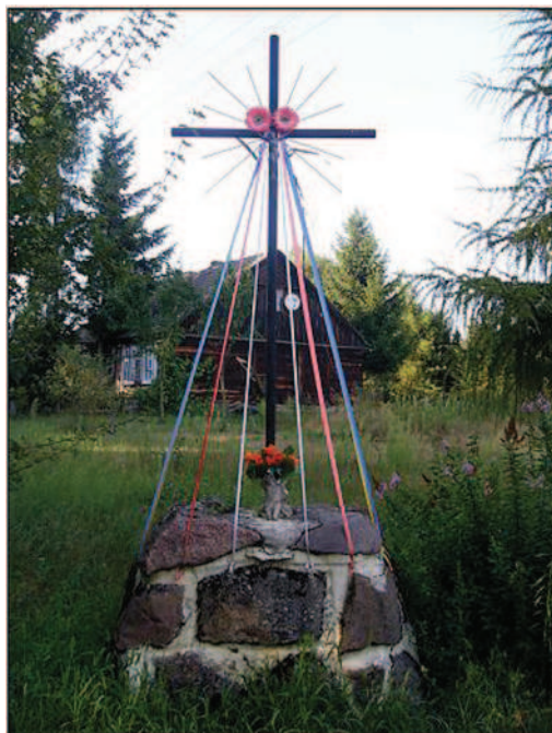
Fot. 17. Krzyż przydrożny w Świerczynie (fot. A. Krajewska, maj 2014 r.)