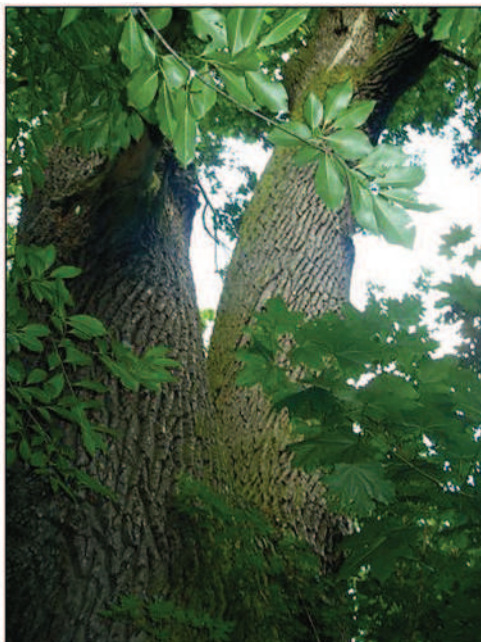
Fot. 5. Największy dąb szypułkowy w parku podworskim w Przystajni (fot. A. Krajewska, czerwiec 2014 r.)