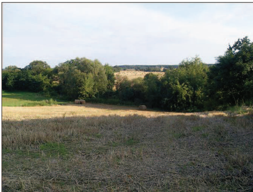
Fot. 8. Nadprośniańskie łągi (fot. A. Krajewska, sierpień 2013 r.)