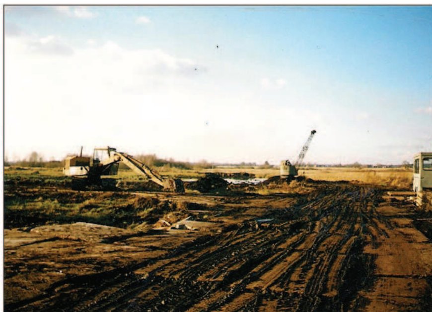
Fot. 18. Wydobycie torfu – torfowisko „Świerczyna”, 2002 r.