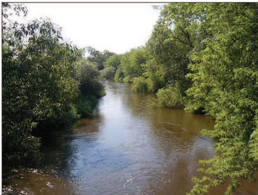
Fot. 2. Rzeka Prosna w Przystajni (fot. A. Krajewska, czerwiec 2014 r.)