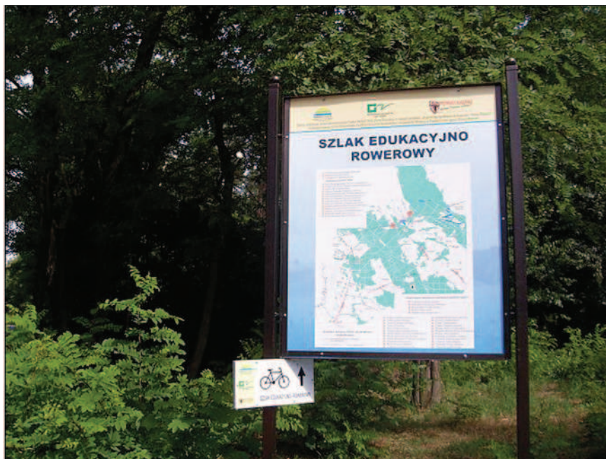
Fot. 1. Tablica informacyjna o szlaku rowerowym w Świerczynie (fot. A. Krajewska, czerwiec 2014 r.)