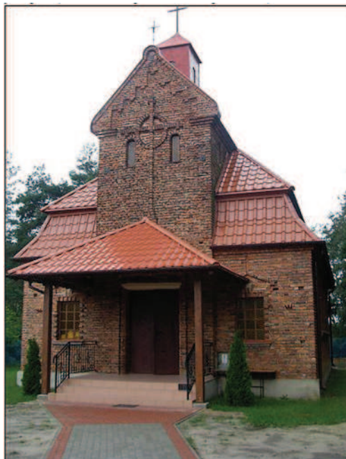
Fot. 13. Kaplica poewangelicka w Przystajni Kolonii (fot. A. Krajewska, maj 2014 r.)