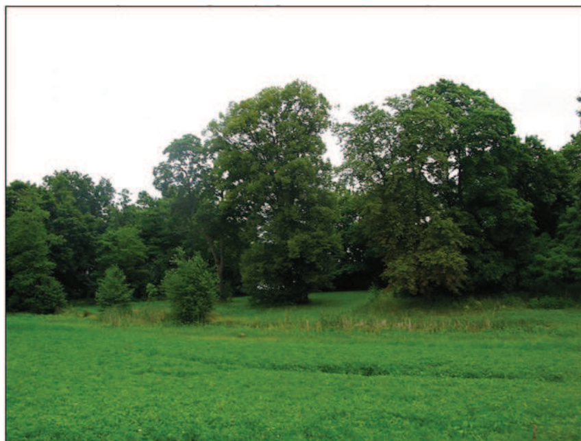
Fot. 4. Park w czerwcu 2014 r. – na pierwszym planie – dno stawu zajęte przez roślinność