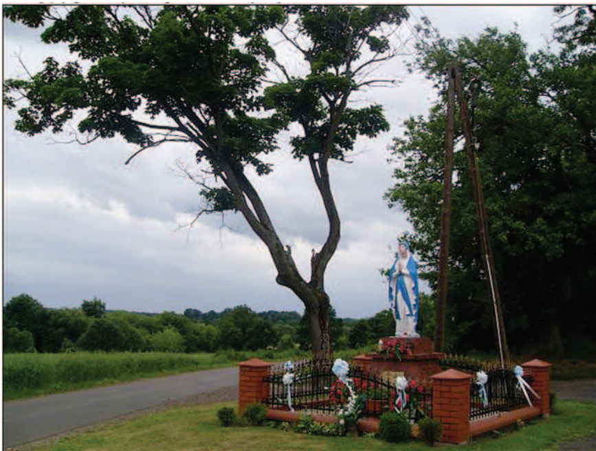
Fot. 7. Figura Najświętszej Marii Panny przed wejściem do parku (fot. A. Krajewska, czerwiec 2014 r.)