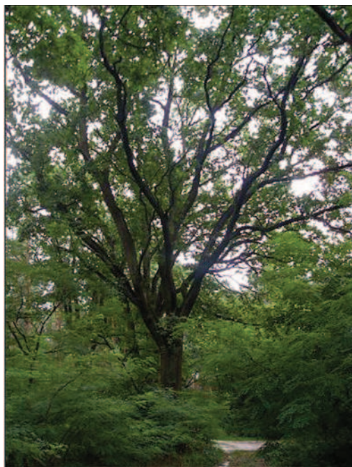
Fot. 25. Dęby szypułkowe na Moczalcu (fot. A. Krajewska, maj 2014 r.)