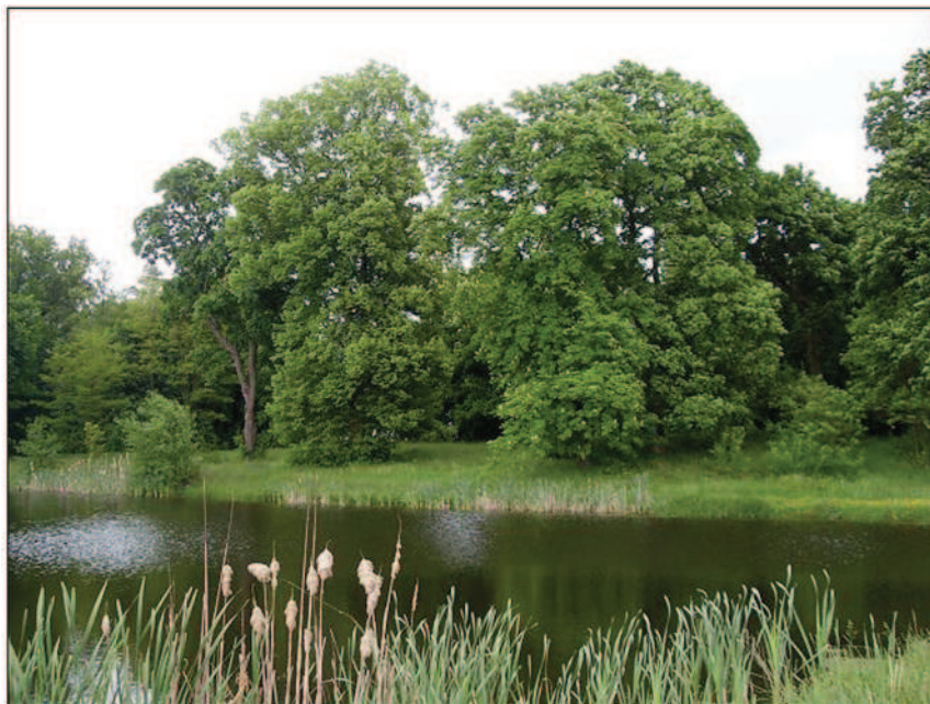
Fot. 3. Park w maju 2013 r. – na pierwszym planie – staw (fot. A. Krajewska, czerwiec 2014 r.)