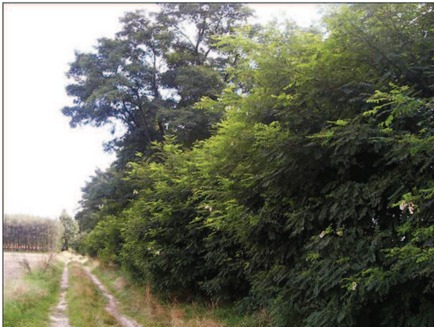
Fot. 23. Zadrzewienie sródpolne w Przystajni Kolonii (fot. A. Krajewska, sierpień 2013 r.)