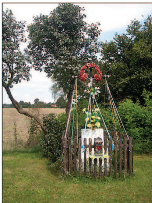
Fot. 16. Krzyż przydrożny w Przystajni Kolonii (fot. A. Krajewska, lipiec 2013 r.)