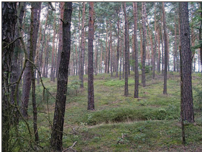
Fot. 27. Wzniesienia na Moczalcu (fot. A. Krajewska, maj 2014r.)