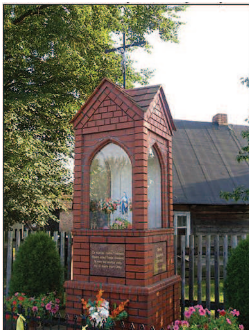
Fot. 12. Kapliczka słupowa na Moczalcu (fot. A. Krajewska, maj 2014 r.)