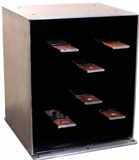
Rys. 1. Trójfazowy transformator przetwornicy elektromobilnej dla stref zabrudzenia PD4

Oddziaływania mechaniczne są niezwykle ważnym aspektem w zastosowaniach elektromobilnych. Metody badań odporności transformatorów na drgania powstające w trakcie ruchu pojazdu i przenoszone na urządzenia zainstalowane na pokładzie definiuje norma PN-EN 61373. Dokument precyzuje