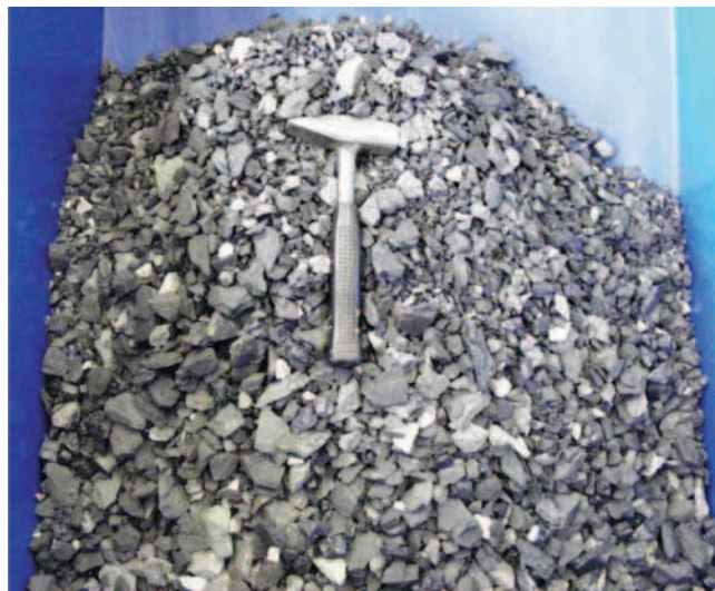
Rys. 3. Mieszanka mineralna 4-31,5 mm wytworzona z odpadów przeróbczych z KWK „Mysłowice-Wesoła”