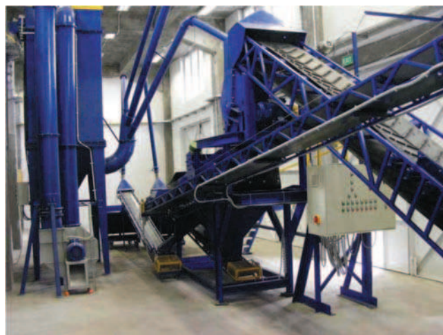
Rys. 1. Instalacja do przeróbki odpadów powęglowych przerobczych gruboziarnistych w Regulicach

Aby osiągnąć podany cel, zaprojektowano i wykonano stacjonarny układ technologiczny kruszenia i przesiewania odpadów powęglowych przerobczych gruboziarnistych 20-150(200) mm, pochodzących ze wzbogacania grawitacyjnego