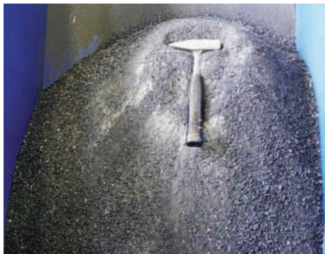
Rys. 4. Produkt 0-4 mm wytworzony z odpadów przeróbczych z KWK „Mysłowice-Wesoła”