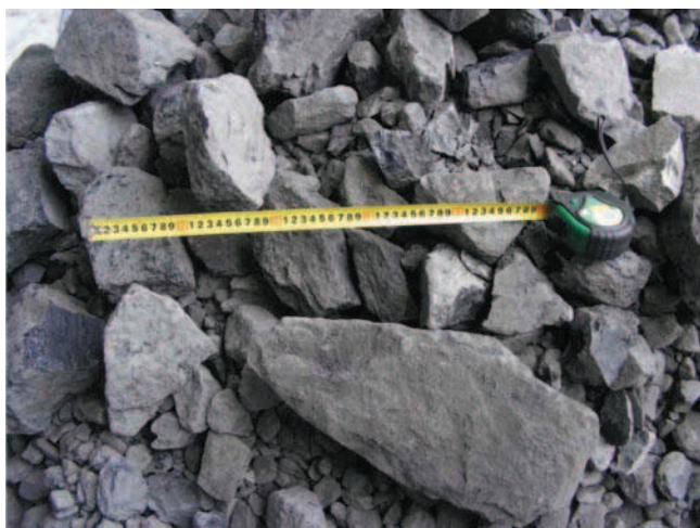
Rys. 2. Odpady przeróbcze z KWK „Mysłowice-Wesoła”

W okresie czerwiec-sierpień 2013 r. w uruchomionej instalacji pilotowej w Regulicach poddano badaniom odpady powęglowe gruboziarniste 20-150 mm ze wzbogacania w separatorach cieczy ciężkiej, pochodzące z dwóch kopalń Katowickiego Holdingu Węglowego: „Wujek” i „Mysłowice-Wesoła” (Ruch „Wesoła”) (rys. 2). Wielkość prób odpadów wykorzystanych do badań wynosiła w każdym przypadku około 300 kg. Jako produkty zastosowanego procesu otrzymano mieszankę 4-31,5 mm (rys. 3) oraz materiał drobnoziarnisty 0-4 mm (rys. 4). W przypadku otrzymanej mieszanki 4-31,5 mm określono następnie jej skład ziarnowy, podstawowe parametry fizykomechaniczne, zawartość wilgoci, zawartość węgla całkowitego, natomiast w przypadku materiału drobnoziarnistego 0-4 mm - zawartość węgla całkowitego, wartość opalową, zawartość popiołu i zawartość siarki.