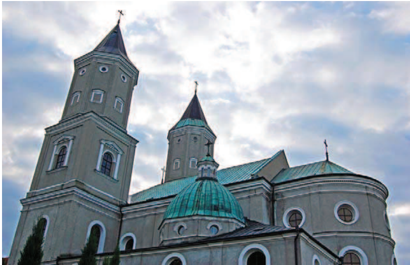
Ryc. 6. Kościół św. św. Mikołaja i Stanisława (opactwo pp. benedyktynek), fot. autorka Fig. 6. The church of St. Nicholas and Stanislas (Benedictine convent), photo: author