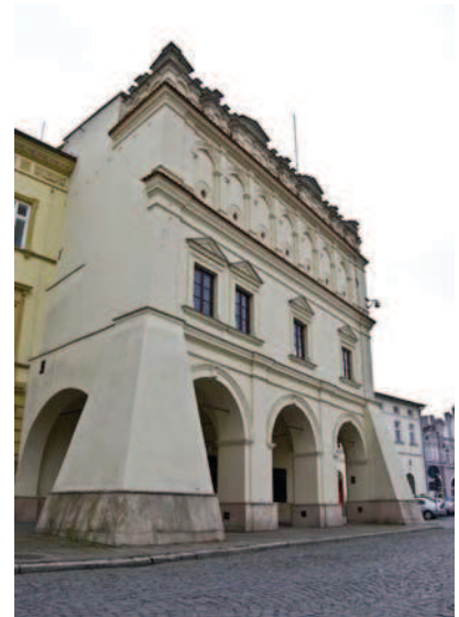
Ryc. 2. Kamienica Orsetti – bryła, fot. autorka Fig. 2. The Orsetti House – its bulk, photo: author