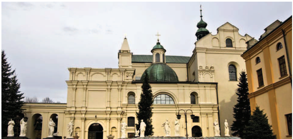
Ryc. 5. Kościół św. Jana (ob. Kolegiata Bożego Ciała) Fig. 5. The church of St. John (currently Collegiate church of Corpus Christi)