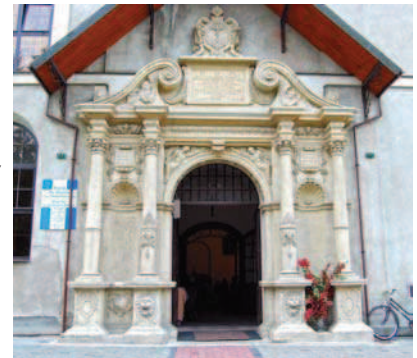
Ryc. 3. Renesansowy portal kościoła św. Mikołaja i Stanisława, fot. autorka Fig. 3. Renaissance portal of the church of St. Nicholas and Stanislas, photo: author