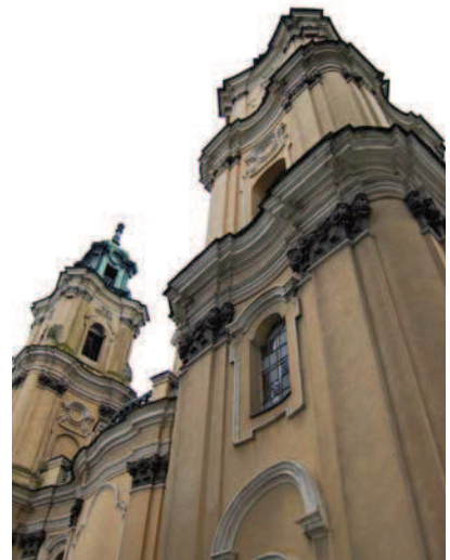
Ryc. 7. Bazylika MBB – płynność i falistość elewacji