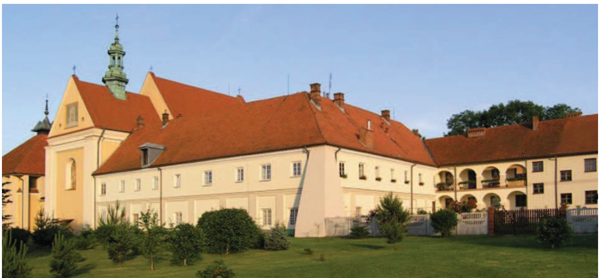
Ryc. 10. Kościół św. Trójcy i klasztor oo. reformatów – widok, źródło: http://www.jaroslaw.pl/zespol-klasztorny-oo-franciszkanow-ofm Fig. 10. The church of Holy Trinity and the Reformist monastery – view, source: http://www.jaroslaw.pl/zespol-klasztorny-oo-franciszkanow-ofm