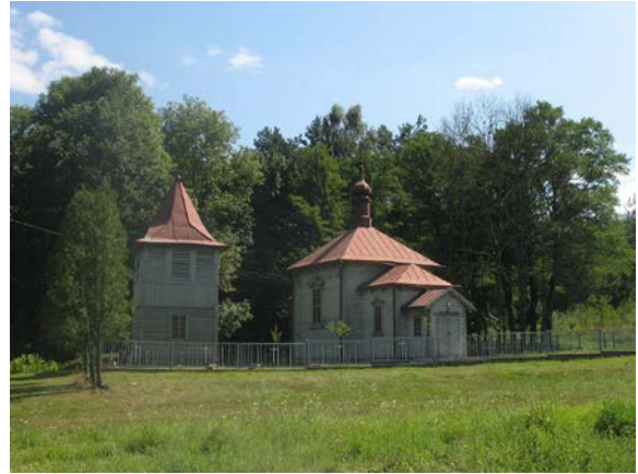
Fot. 2. Zespół cerkiewny (obecnie kościół) w Potoczku. Photo 1. Orthodox complex (currently church) in Potoczek.