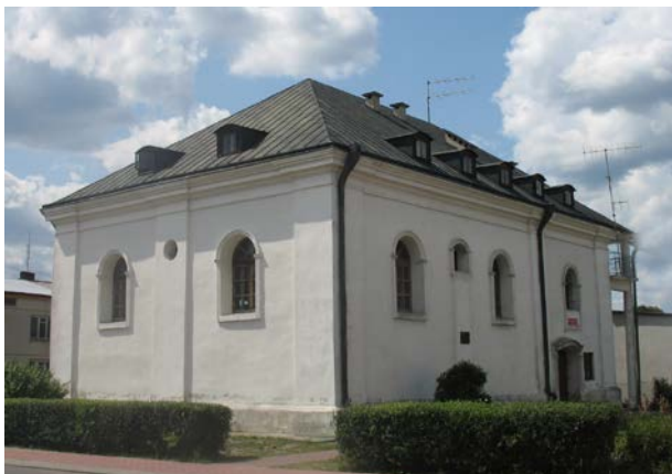
Fot. 5. Synagoga w Józefowie, obecnie Biblioteka. Photo 5. Synagogue in Józefów, currently library.