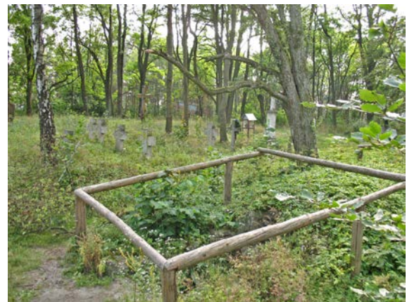
Fot. 6. Monaterz – pozostałości klasztoru, cmentarza wojennego i ukraińskiego. Photo 6. Remains of monastery, war and Ukrainian cemetery.