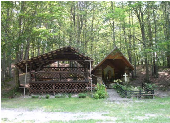
Fot. 3. Otoczenie zabytkowej kaplicy w Nowinach Horynieckich. Photo 3. Surrounding of historic chapel in Nowiny Horynieckie.