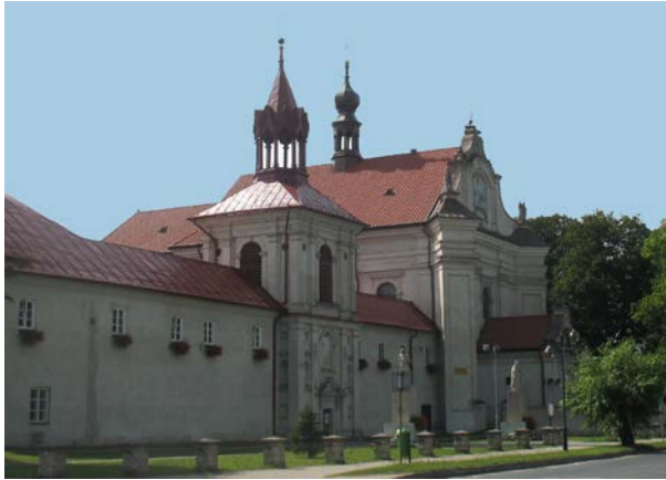
Fot. 1. Zespół klasztorny w Krasnobrodzie. Photo 1. Monastery complex in Krasnobród.