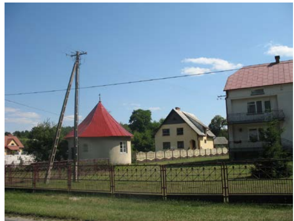
Fot. 4. Otoczenie kaplicy św. Onufrego w Krasnobrodzie. Photo 4. Surrounding of St Onufry chapel in Krasnobród.