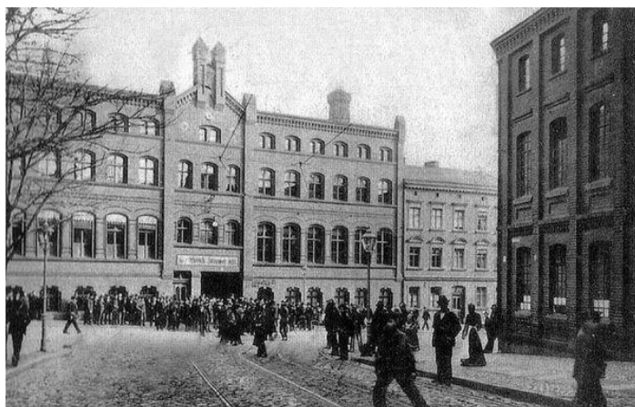
Fig. 2. View of the 19th century factory from Niemierzyńska Street. Source: [10]

Ryc. 2. Widok na XIX wieczną fabrykę od strony ulicy Niemierzyńskiej. Źródło: [10]