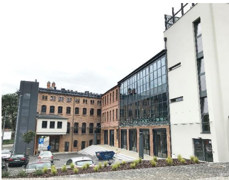
Fig. 4. View of the corner of the revitalized Factory II from the courtyard.

Ryc. 3. Widok na południowo-zachodnią elewację zrewitalizowanej Fabryki II.