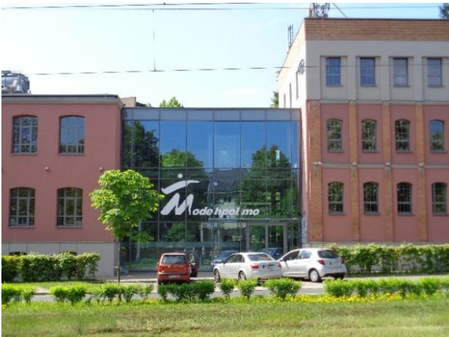
Fig. 6. View on the connecting passage of Factory I at Al. Wojska Polskiego Avenue.

Ryc. 5. Widok na południowo-wschodnią elewację Fabryki I przy Al. Wojska Polskiego 184C.