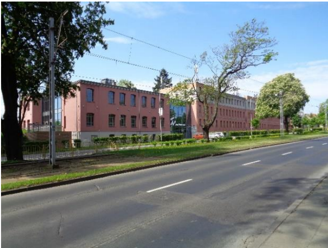
Fig. 5. View of the south-eastern façade of the Factory I at Al. Wojska Polskiego Avenue.

buses) is available nearby, directly connecting the place to the city center. In the right-of-way, 30 parking spaces have been provided in front of the building, including a space for wheelchair users (Fig. 5, 6).