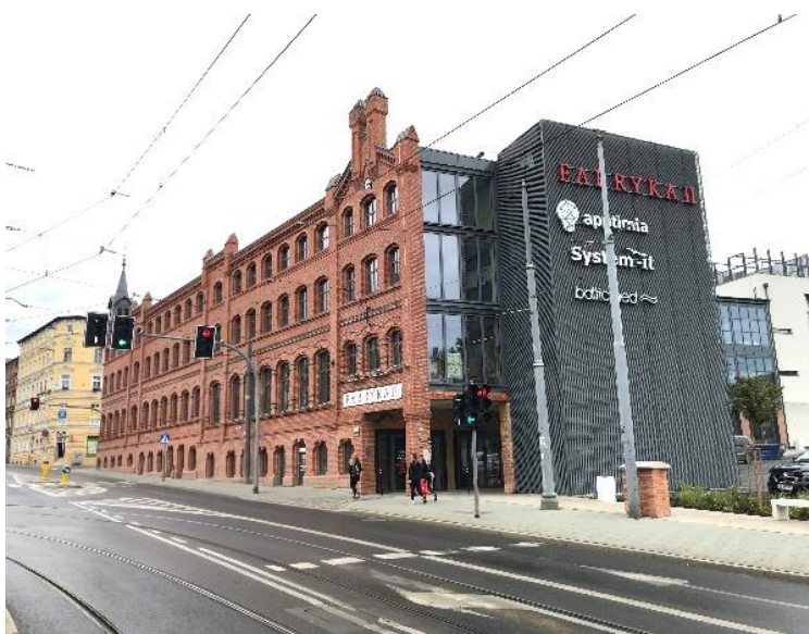
Fig. 3. View of the south-western façade of the revitalized Factory II.