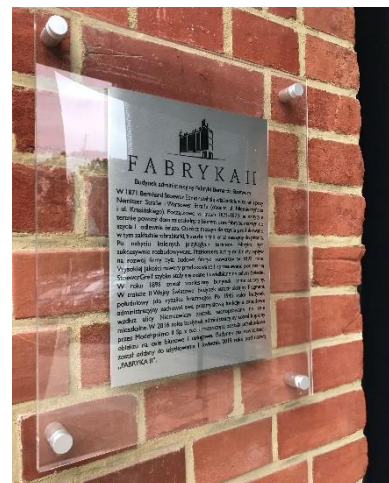
Fig. 7. An information board attached to the façade of the Factory II building, on which the history of the Stoewer's factory is described.

Factory buildings described in the article could be perceived in the past by residents as a symbol of a particular company, but today when office spaces are rented by various independent companies, buildings have become somewhat anonymous. Nevertheless, thanks to the revitalization of post-industrial buildings, they may still affect the younger generations to a certain extent. This is possible thanks to the illustrations displayed in their interior, showing the history of the production of sewing machines and cars, and on the façades of Factory I and Factory II there are information boards.