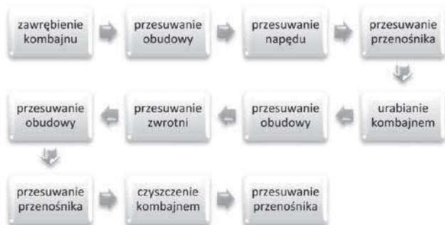
Rys. 1. Mapa procesu dla technologii jednokierunkowego urabiania kombajnem

Mapę procesu dla technologii jednokierunkowego urabiania zamieszczono na rysunku 1.