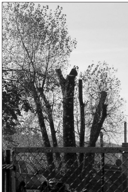
Rys. 1. Nadmiernie przycięte korony drzew nad Jeziorem Krzywym w Olsztynie