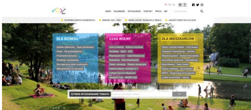
Rys. 3. Zrzut ekranu nowej wersji strony internetowej UMŁ Źródło: www.lodz.pl [10] [dostęp: 30.08.2018].