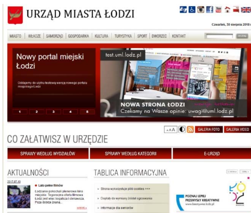
Rys. 2. Zrzut ekranu poprzedniej wersji strony internetowej UMŁ Źródło: www.archiwum.uml.lodz.pl [9] [dostęp: 30.08.2018].

lowy (uwagi@uml.lodz.pl), na który mieszkańcy mogli przysyłać swoje spostrzeżenia i uwagi dotyczące funkcjonalności oraz treści zawartych na nowej wersji strony [8]. Rysunki 2 i 3 przedstawiają zdjęcia obu wersji stron internetowych.