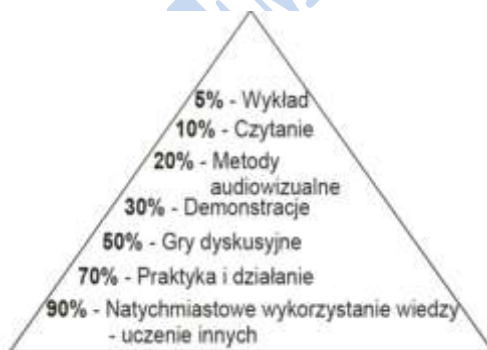
Rys. 3. Piramida zapamiętywania według Dale'a [9]

Na każdym etapie należy brać pod uwagę, że osiągnięcie perfekcji jest nierealne. Najistotniejszy jest choćby najmniejszy postęp. Nie powinno się zakładać, że błąd nigdy nie wystąpi. Celem jest zadbanie o to, aby w procesie ich eliminowania istniało ciągle doskonalenie [3].